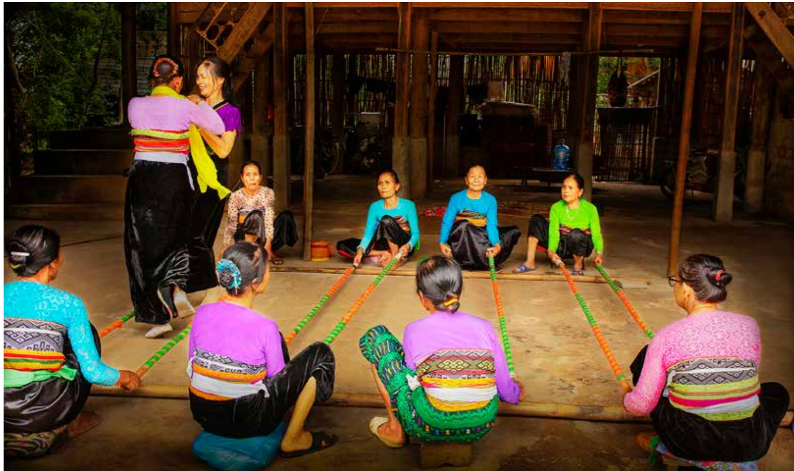
Phụ nữ Mai châu tham gia hoạt động du lịch Văn hóa