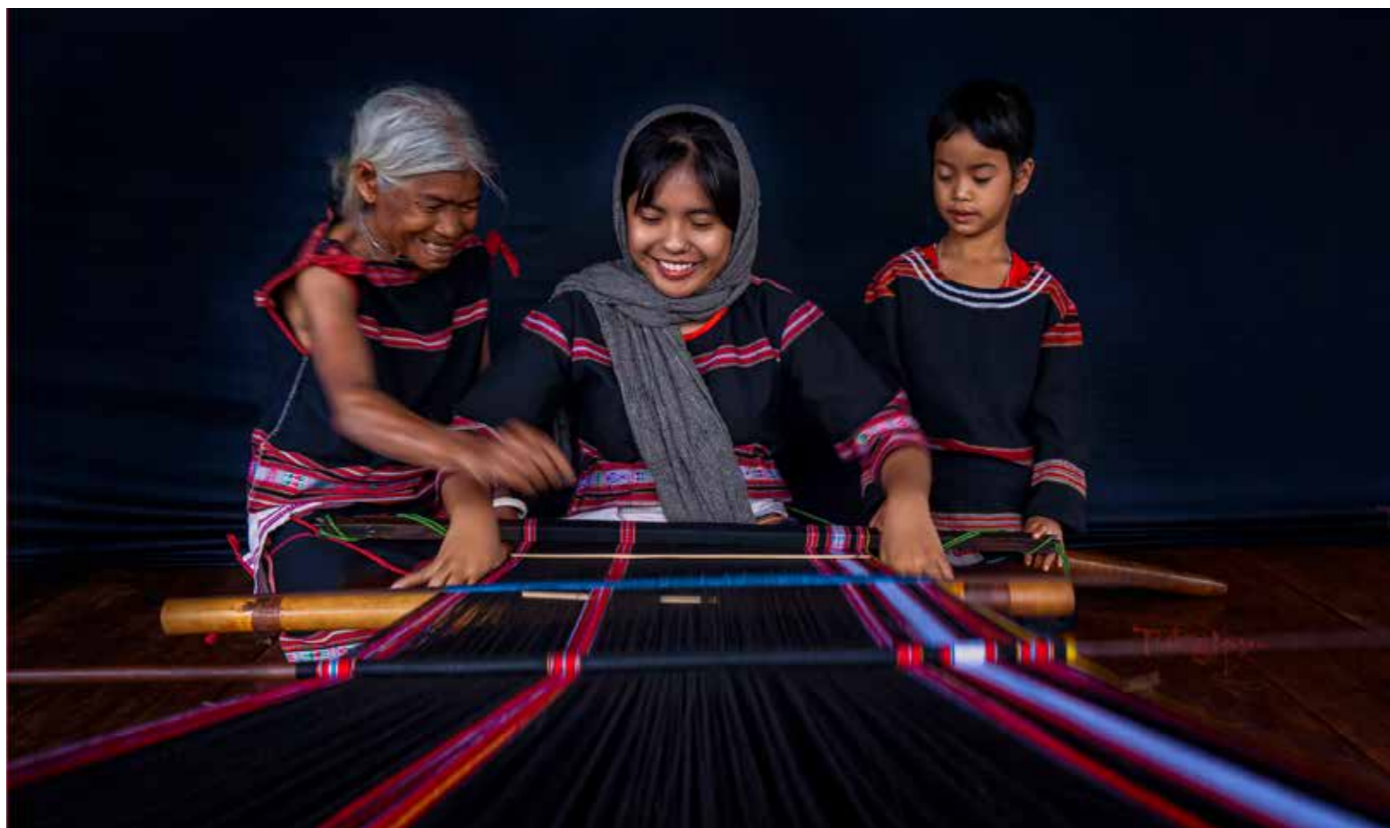
Dệt thổ cẩm