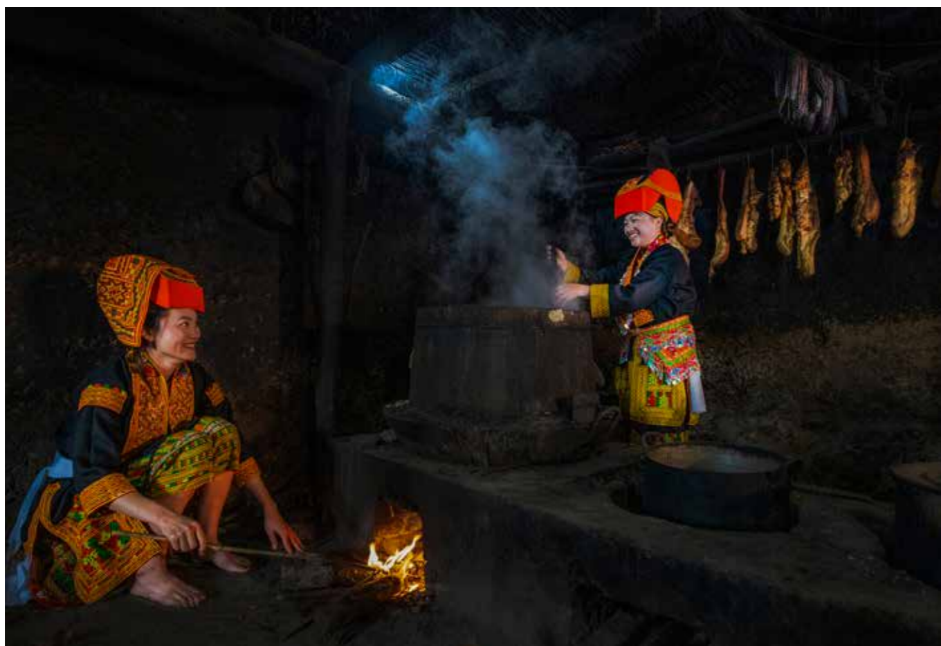
Vẻ đẹp người phụ nữ Dao Lù Gang