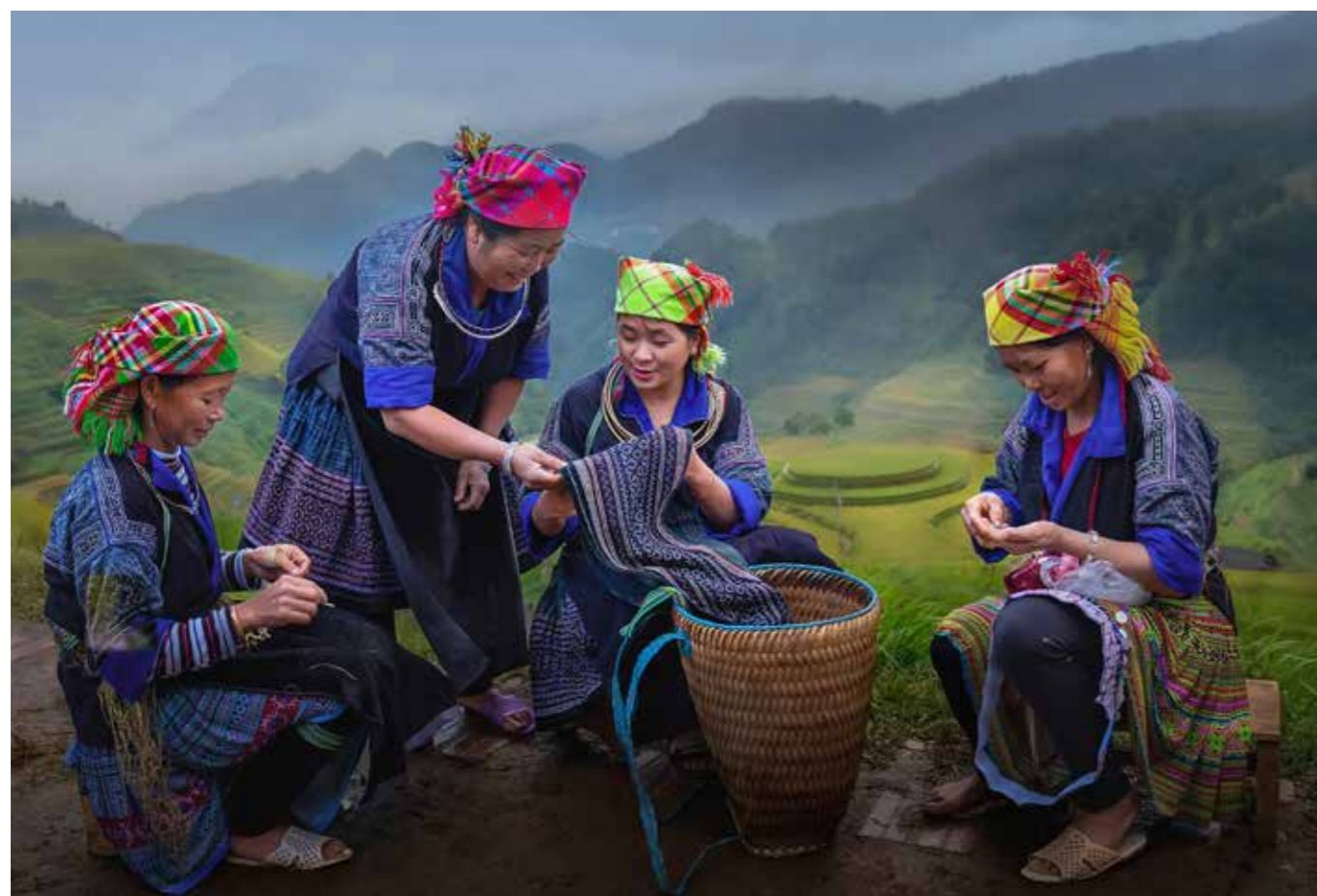
Những người phụ nữ Mông thêu váy thổ cẩm