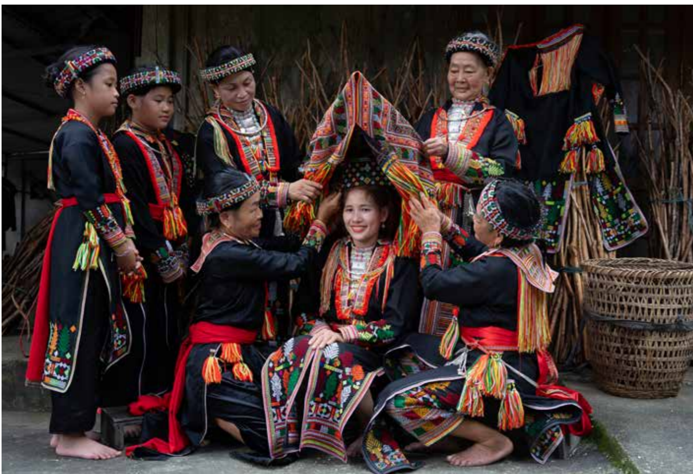
Cô dâu trong ngày vui hạnh phúc