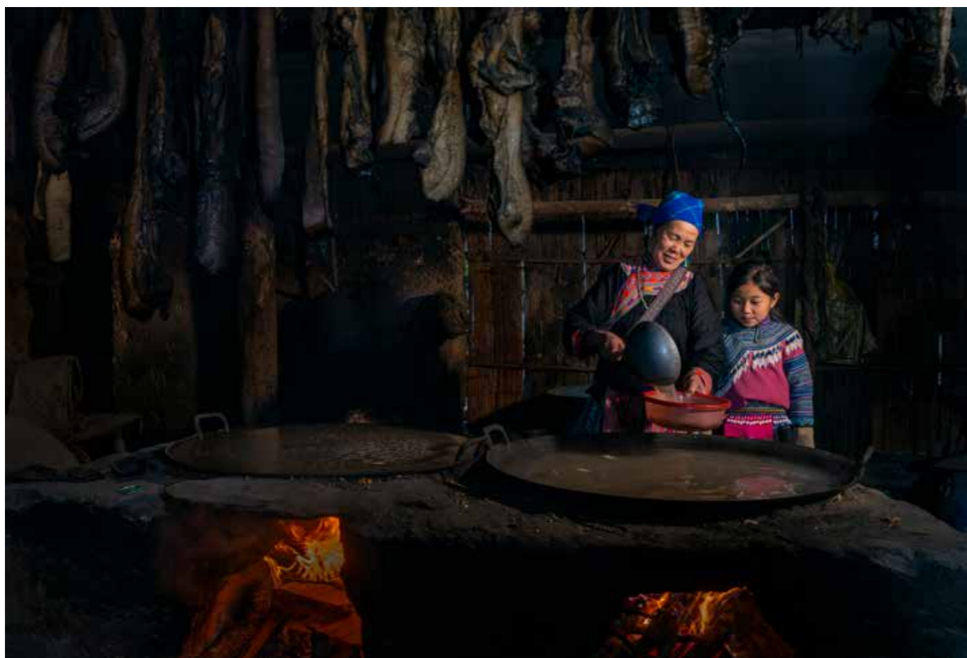
Bên bếp lửa hồng