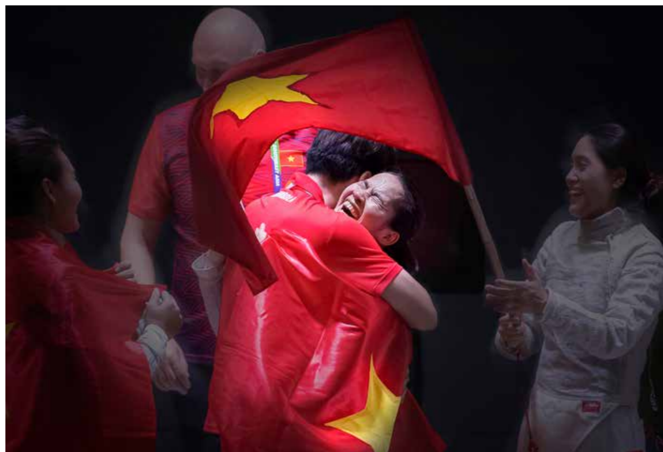
Niềm vui chiến thắng