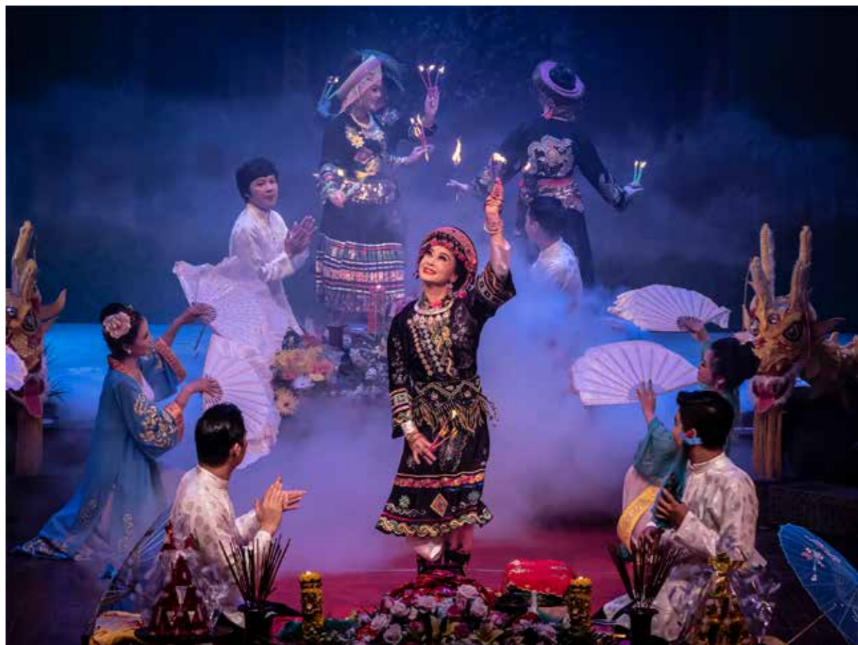
Biểu diễn hầu đồng của Nhà hát Chèo Việt Nam