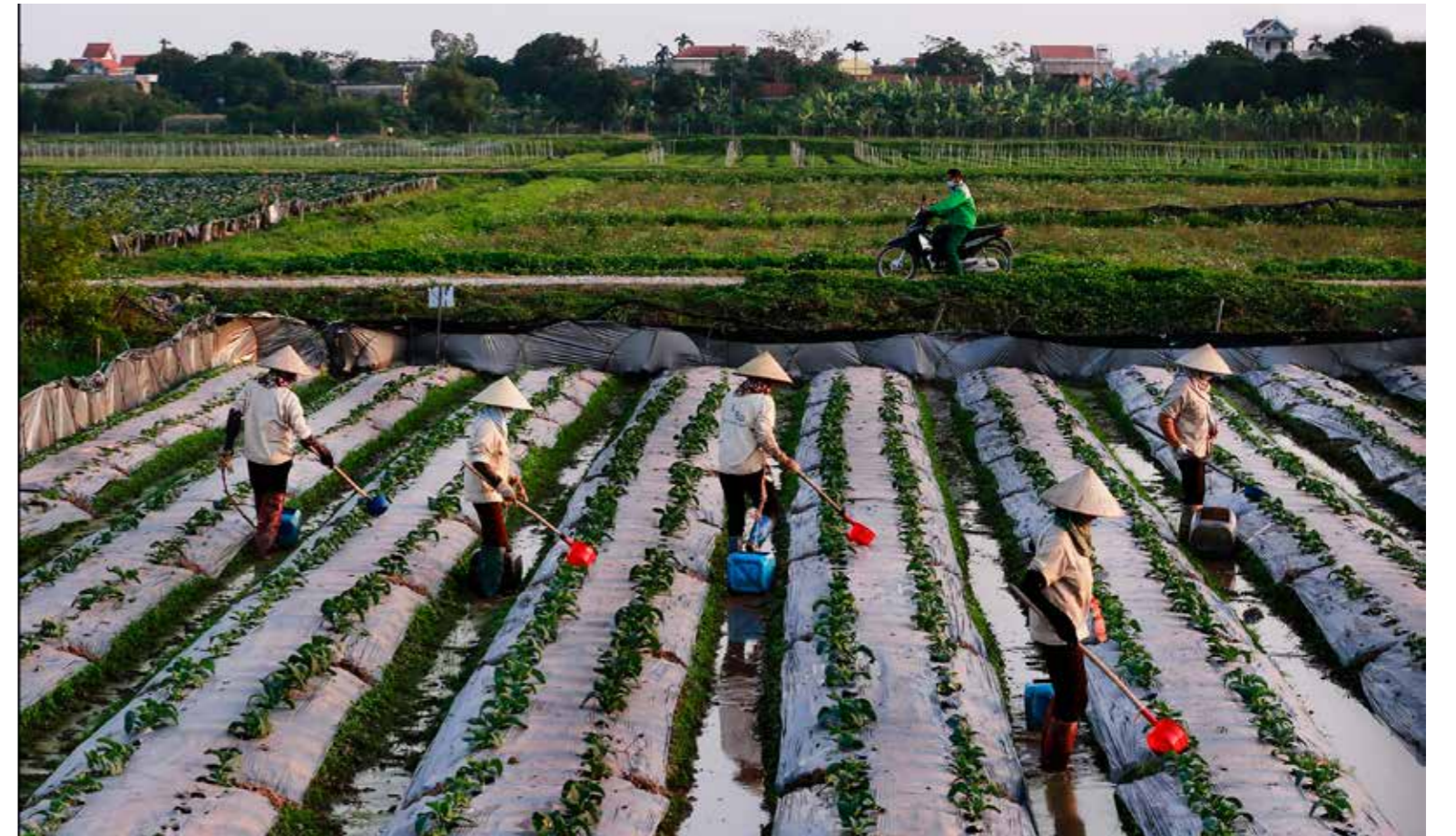
Vùng rau sạch