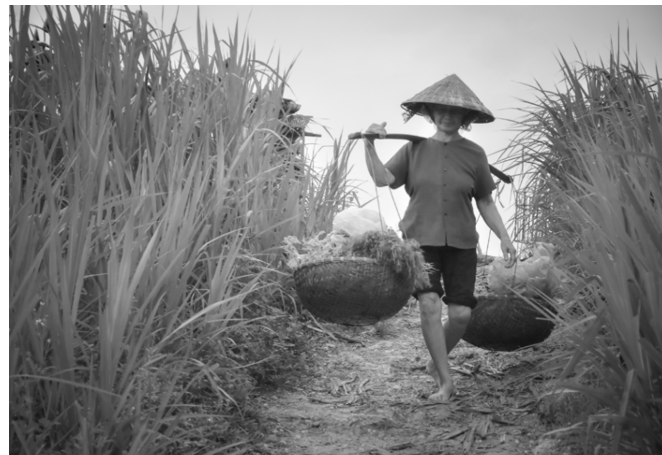
Tản tử sớm hôm