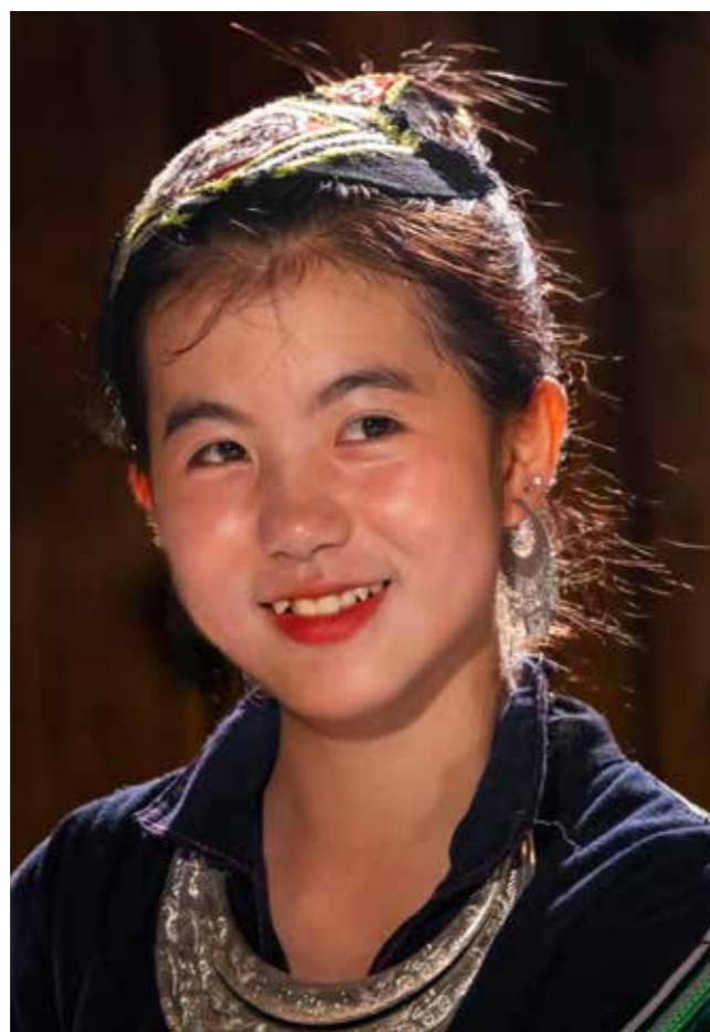
Thiếu nữ ở bản Cát Cát - Sapa