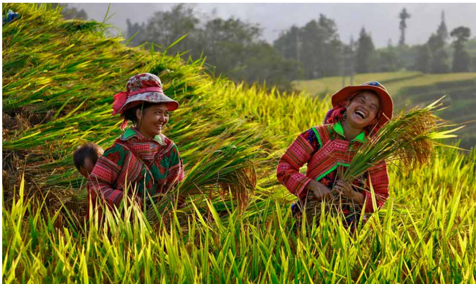
Mùa Lúa Chín