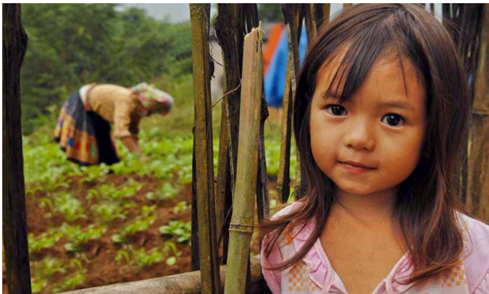
Bên khu vườn nhà