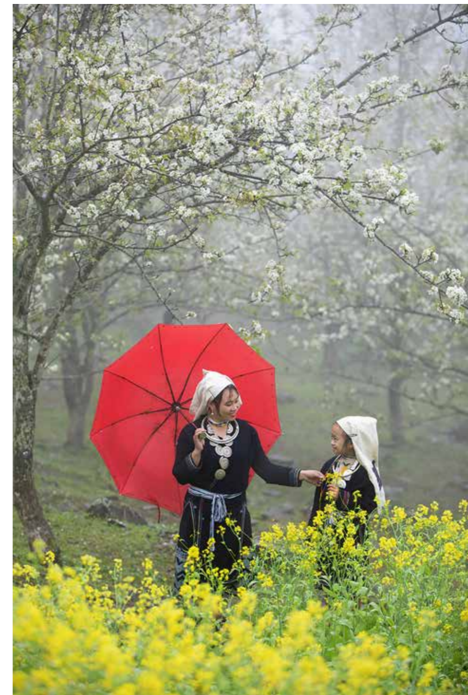
Mùa xuân đến