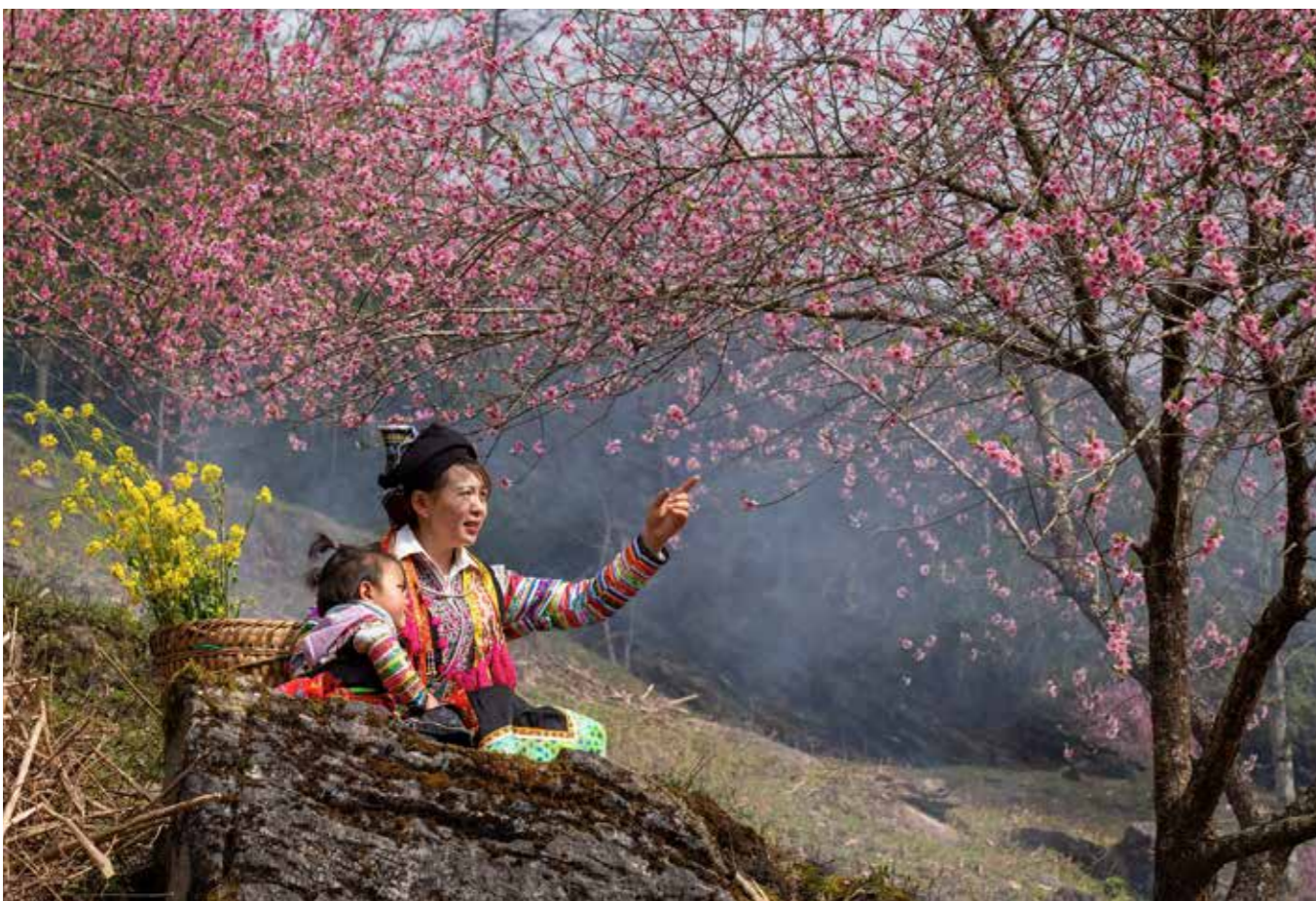
Mùa Xuân của Mẹ & Bé