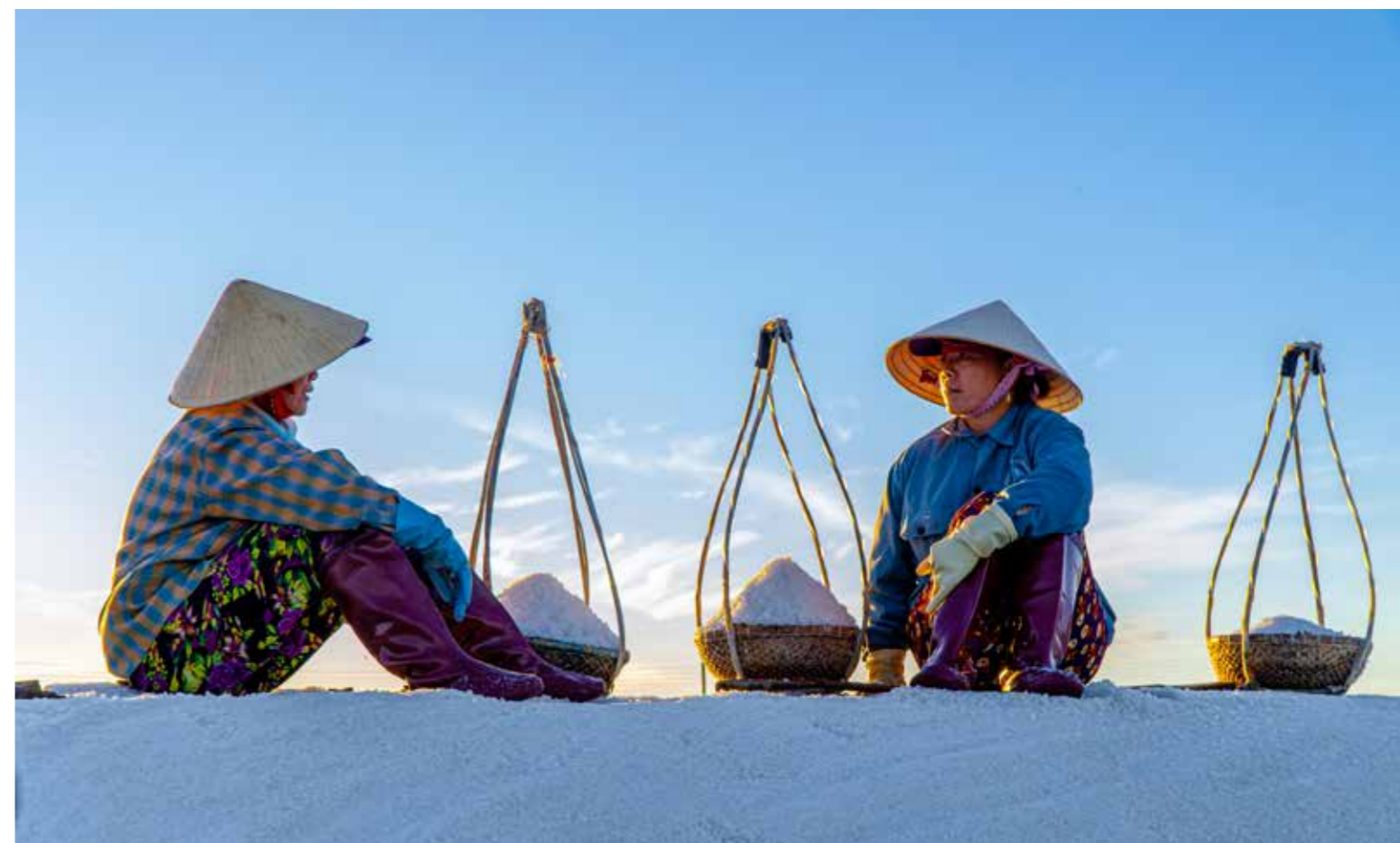
Phụ nữ nghỉ ngơi