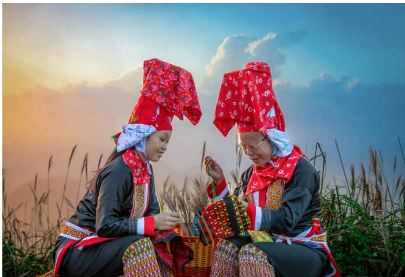
Phụ nữ dân tộc giữ nghề thêu truyền thống