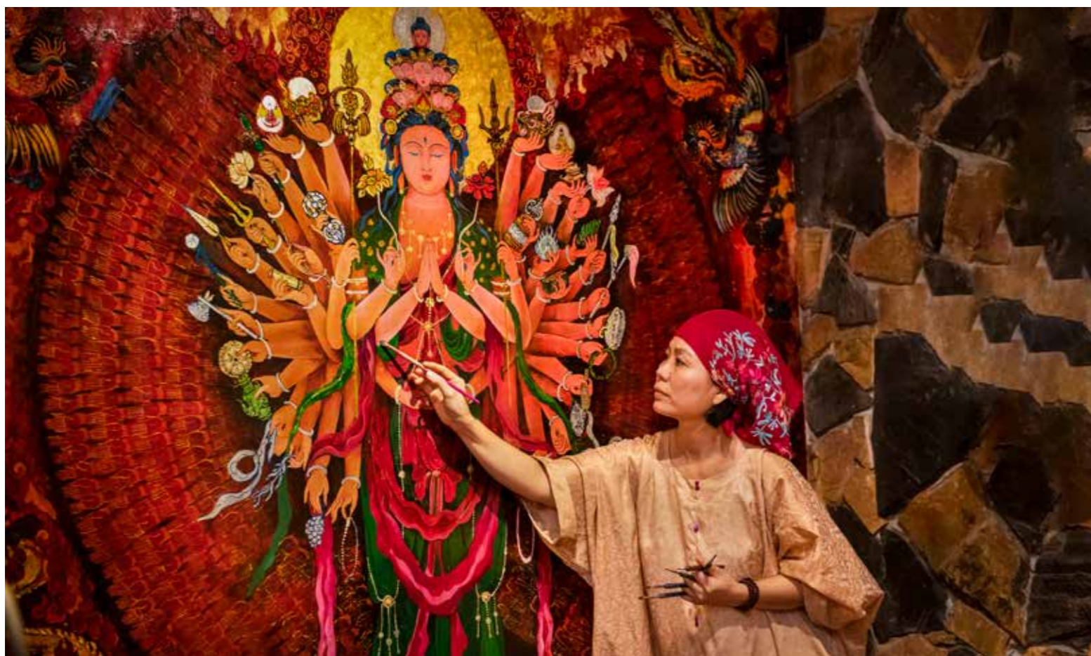
Nét vẽ an nhiên