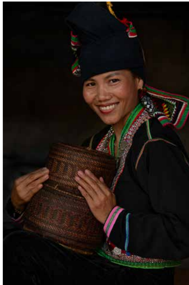
Cô gái Dân tộc Khơ Mú