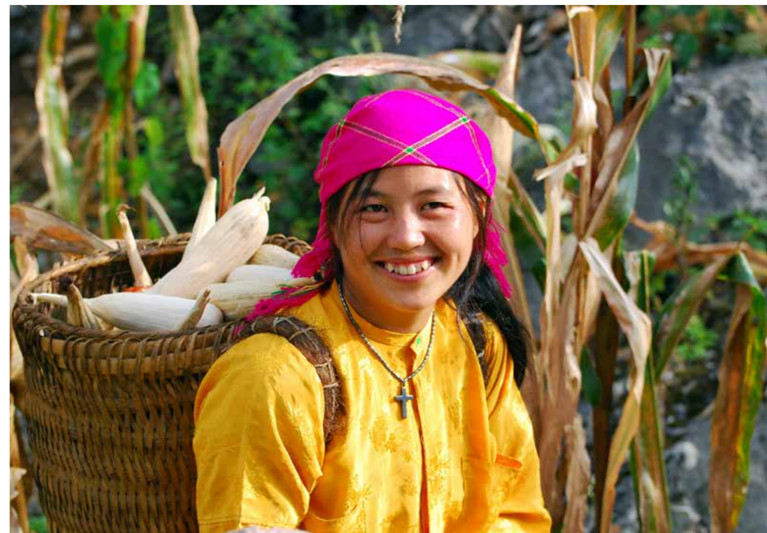
Nụ cười Xuân