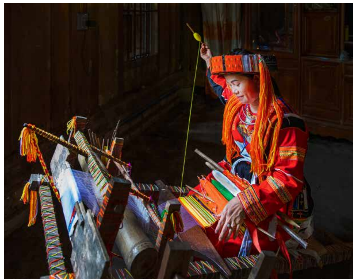
Nghề dệt của phụ nữ Pà Thén