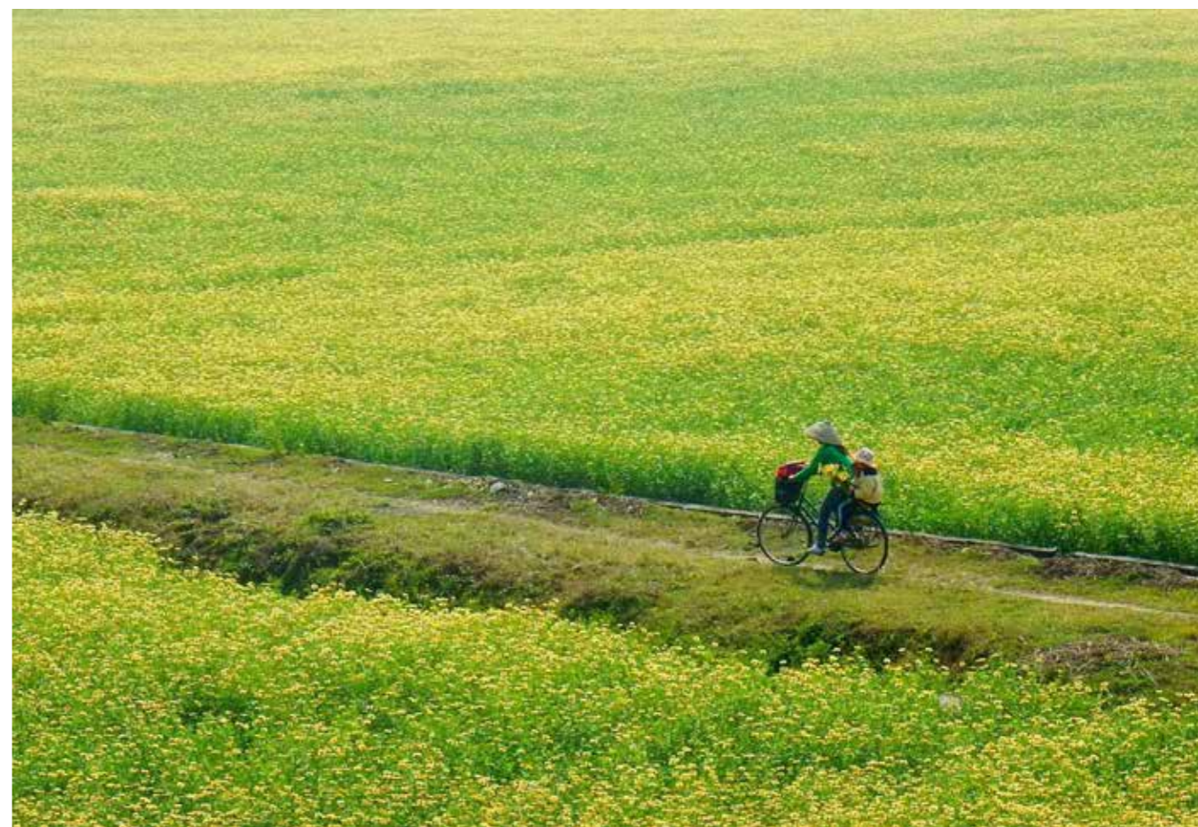
Trên cánh đồng quê