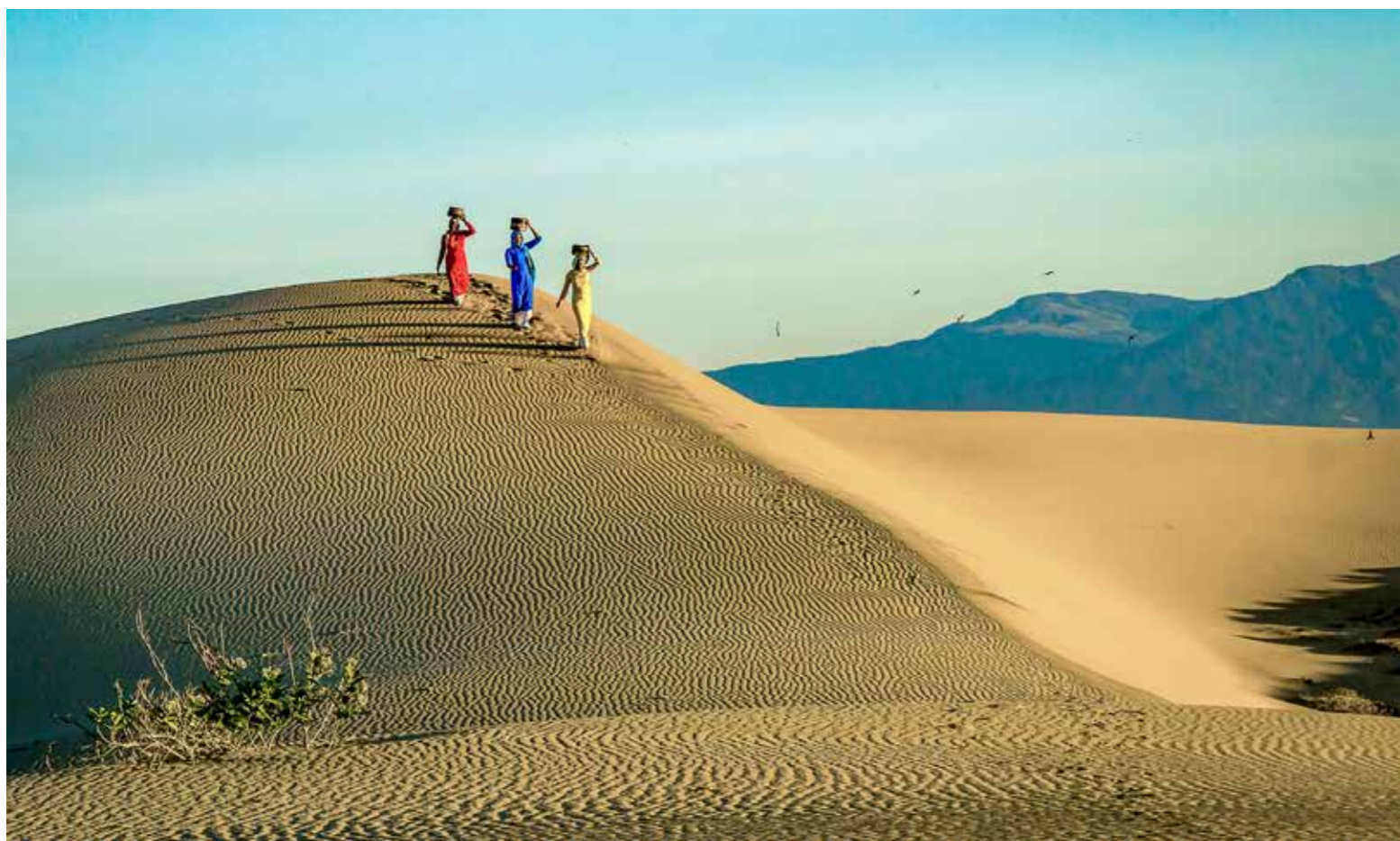
Bình minh trên đồi cát Nam Cương