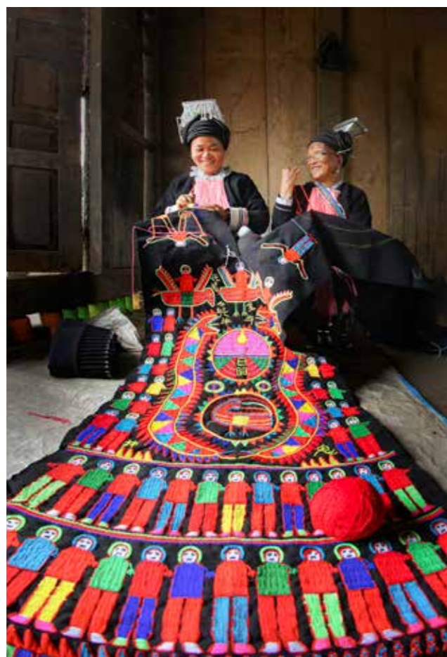
Sắc màu dân tộc Dao