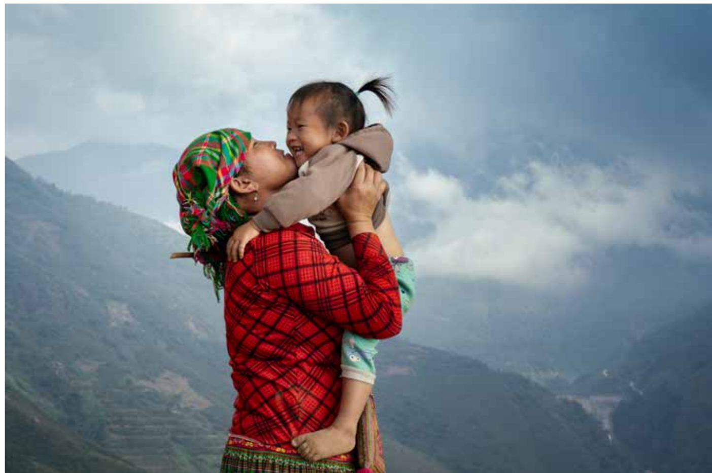
Theo mẹ đi làm