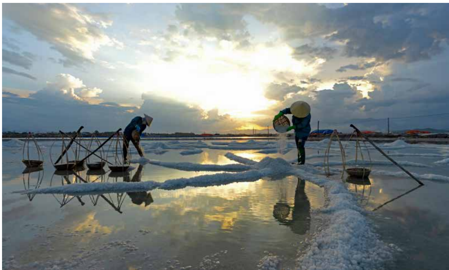
Nghề làm muối