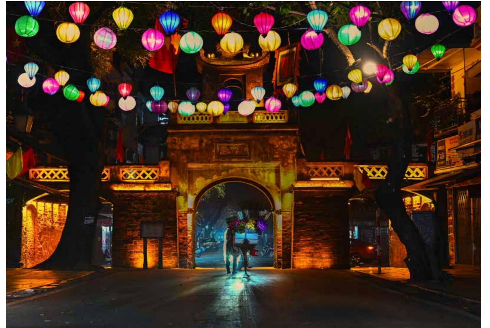
Người giữ hồn phố cổ