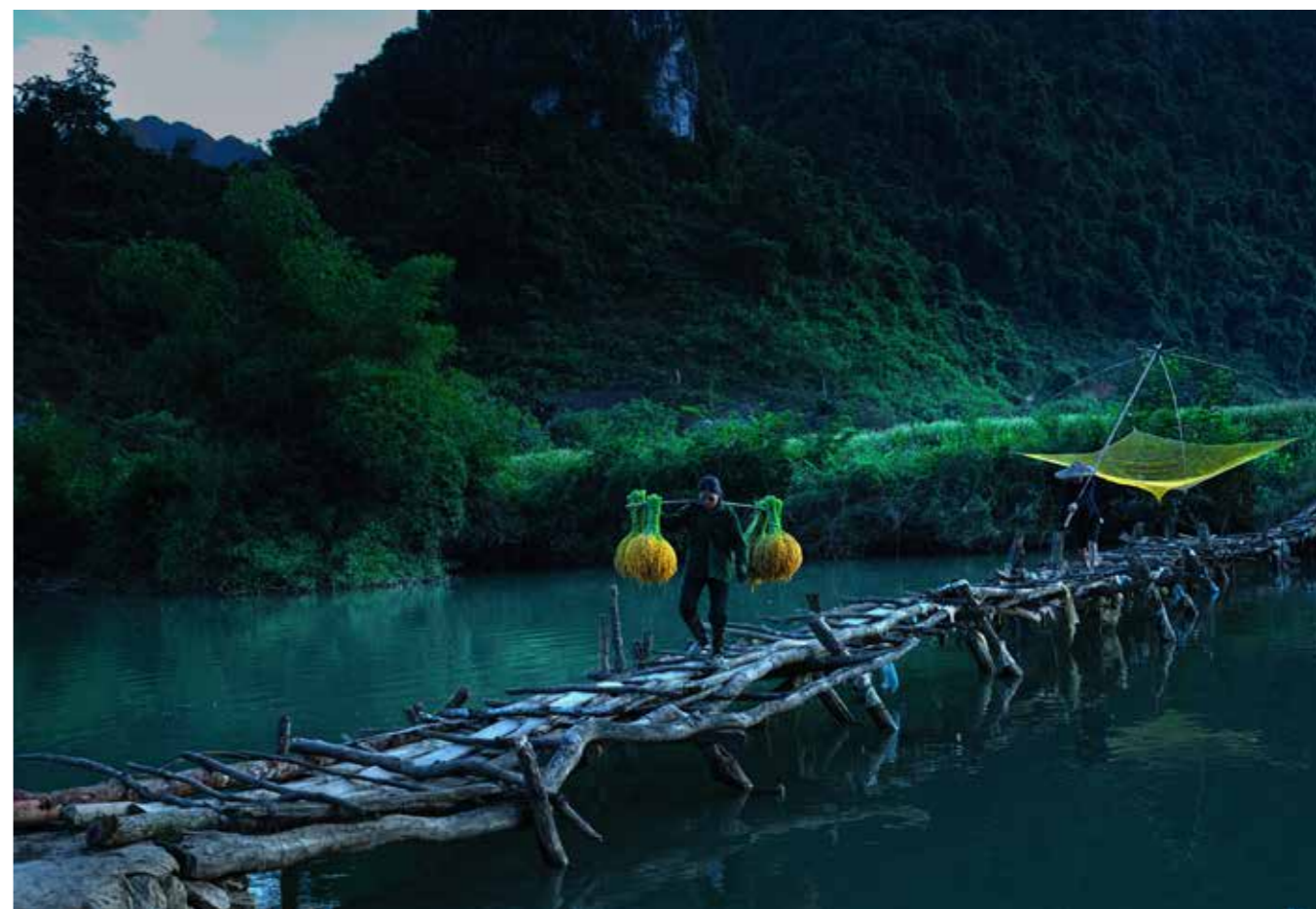
Gánh lúa về nhà