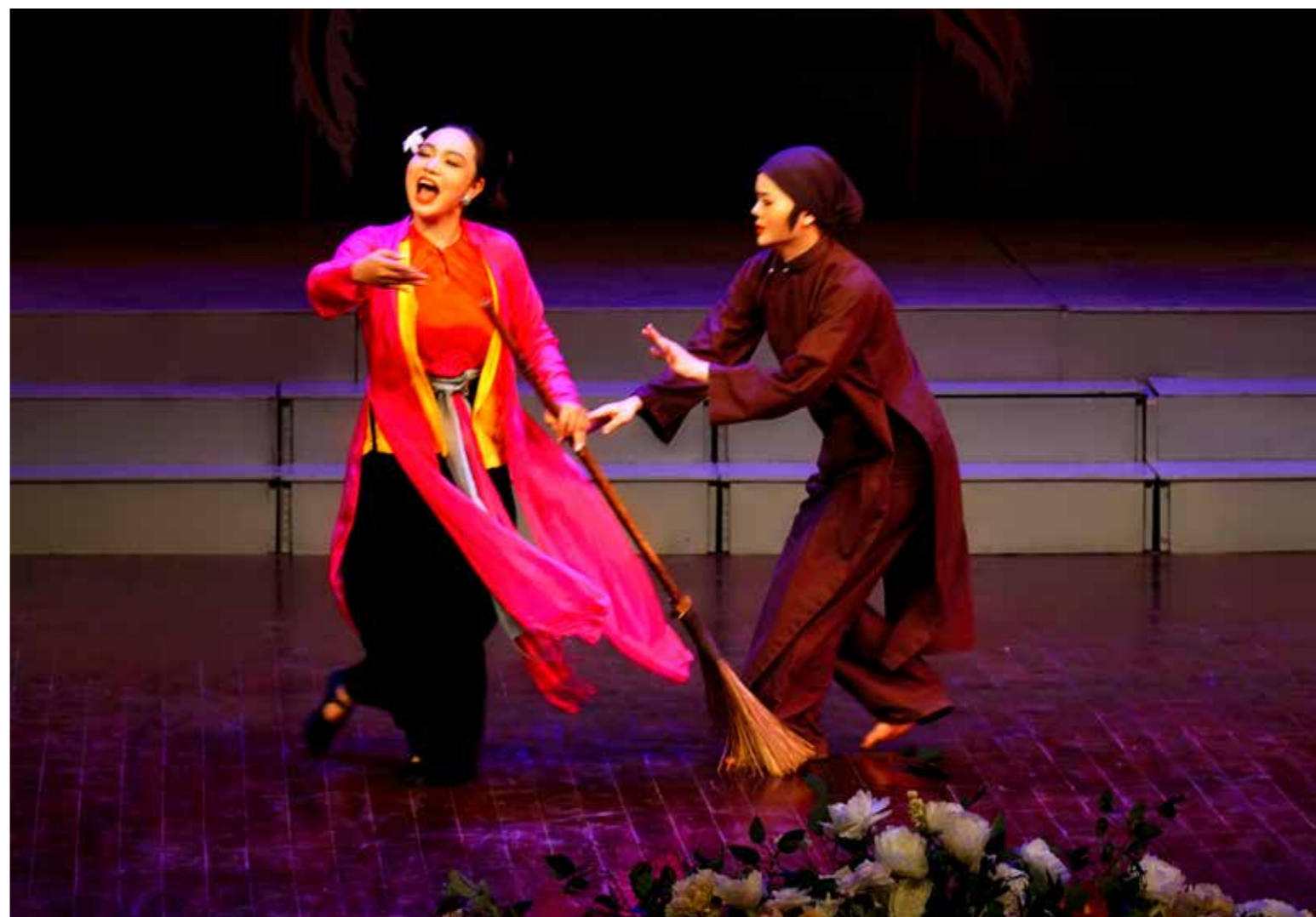
Đấy rồi nhé !... Đưa chổi dầy em quét cho...!