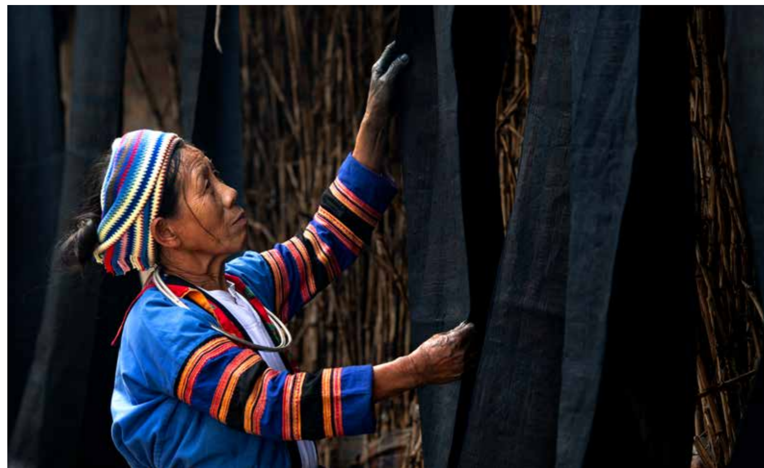
Phụ nữ Tuyên Quang với nghề thủ công