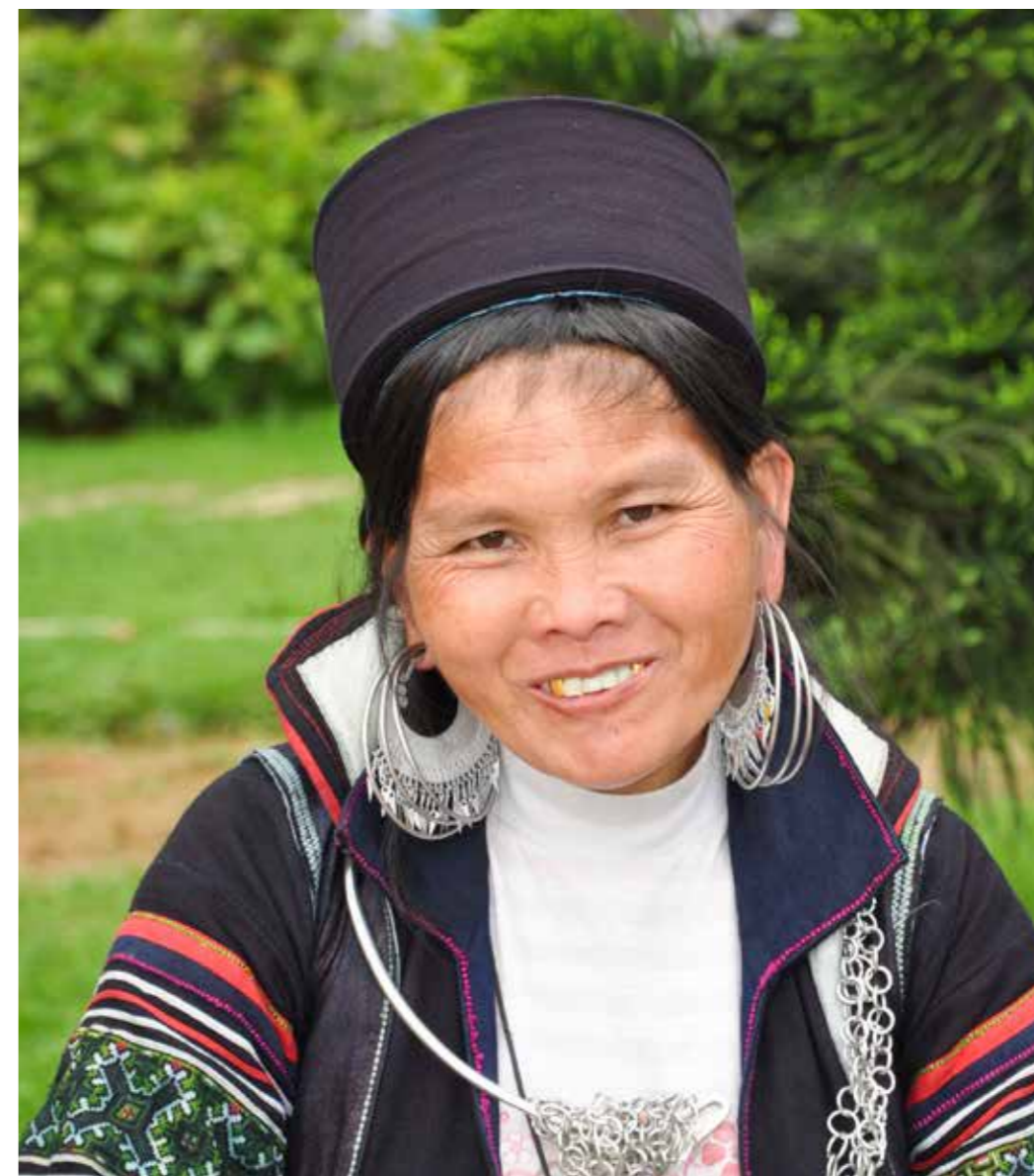
Nụ cười người phụ nữ Mông