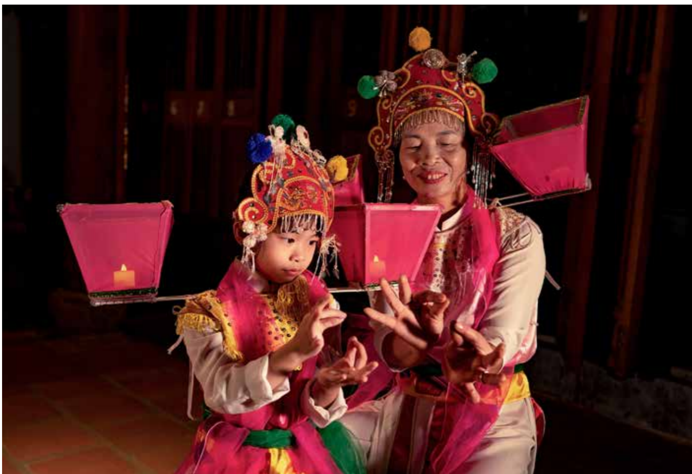
Bà dạy bé điệu múa cổ Bài Bông