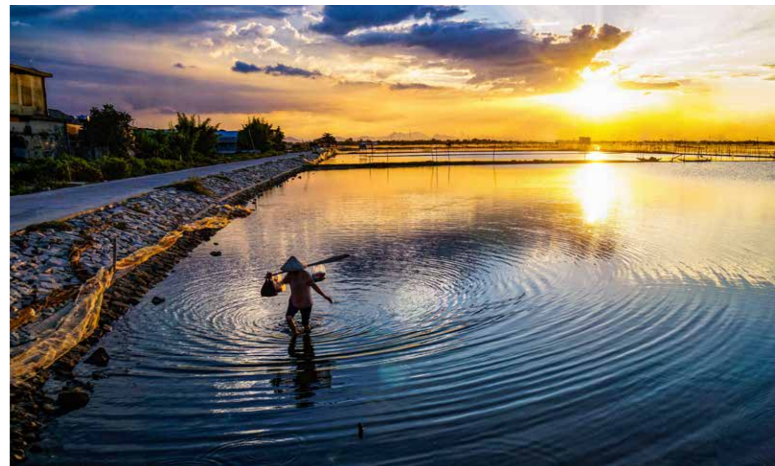
Cái cò lặn lội