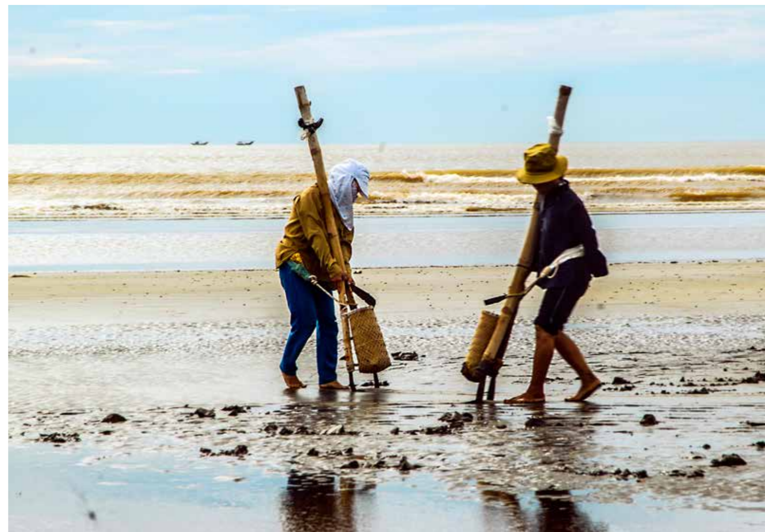
Cào ngao trên biển Diễn Châu