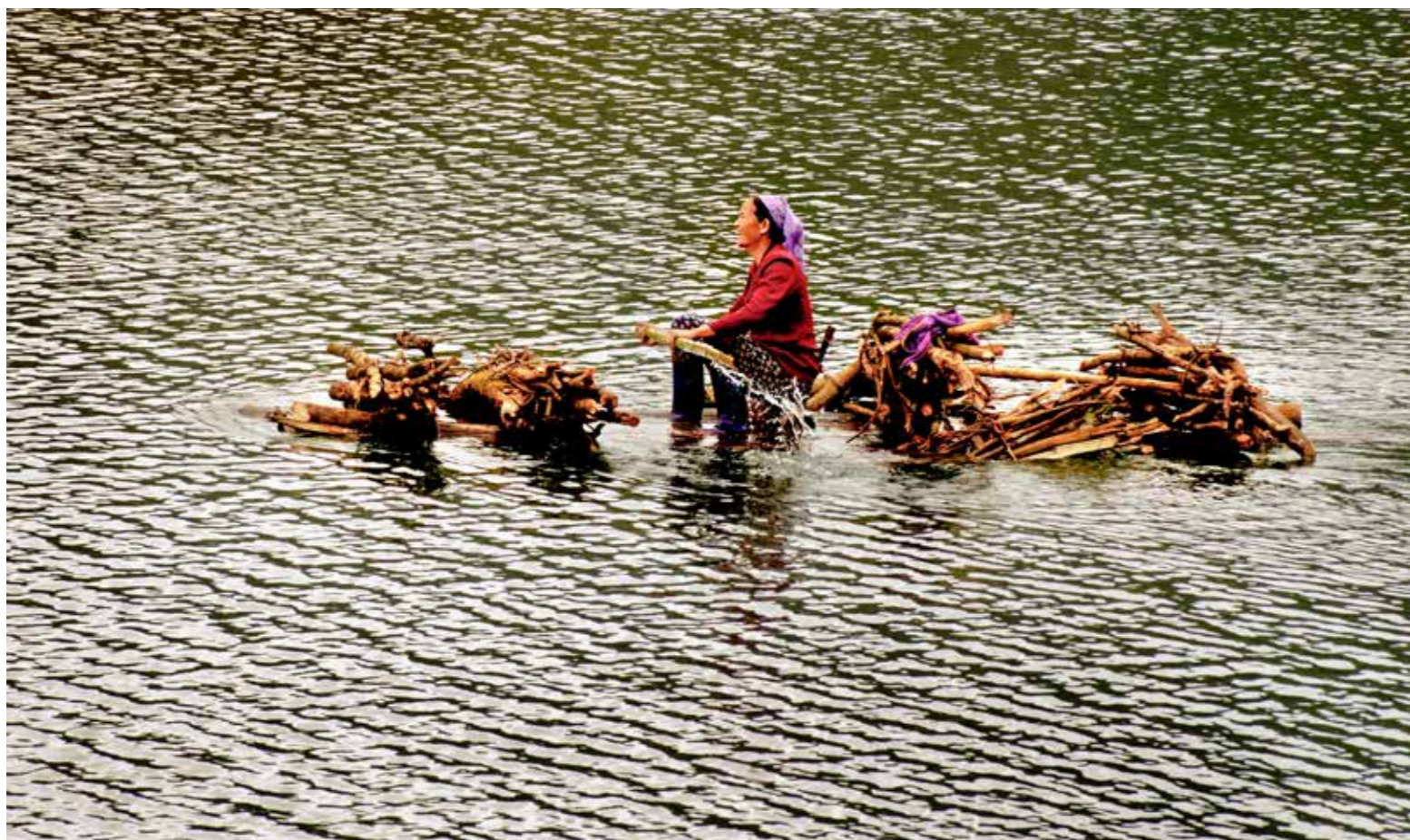
Suôi dòng trên hồ bản viết Cao Bằng