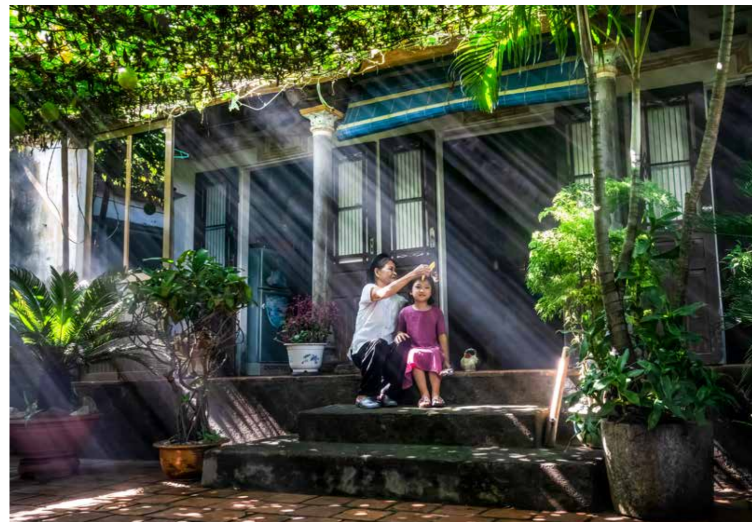
Bà và cháu