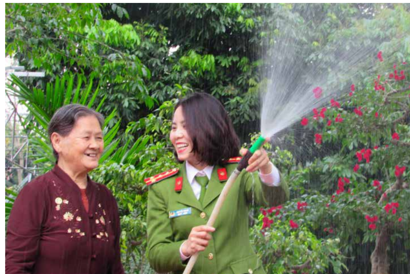
Nụ cười của mùa xuân