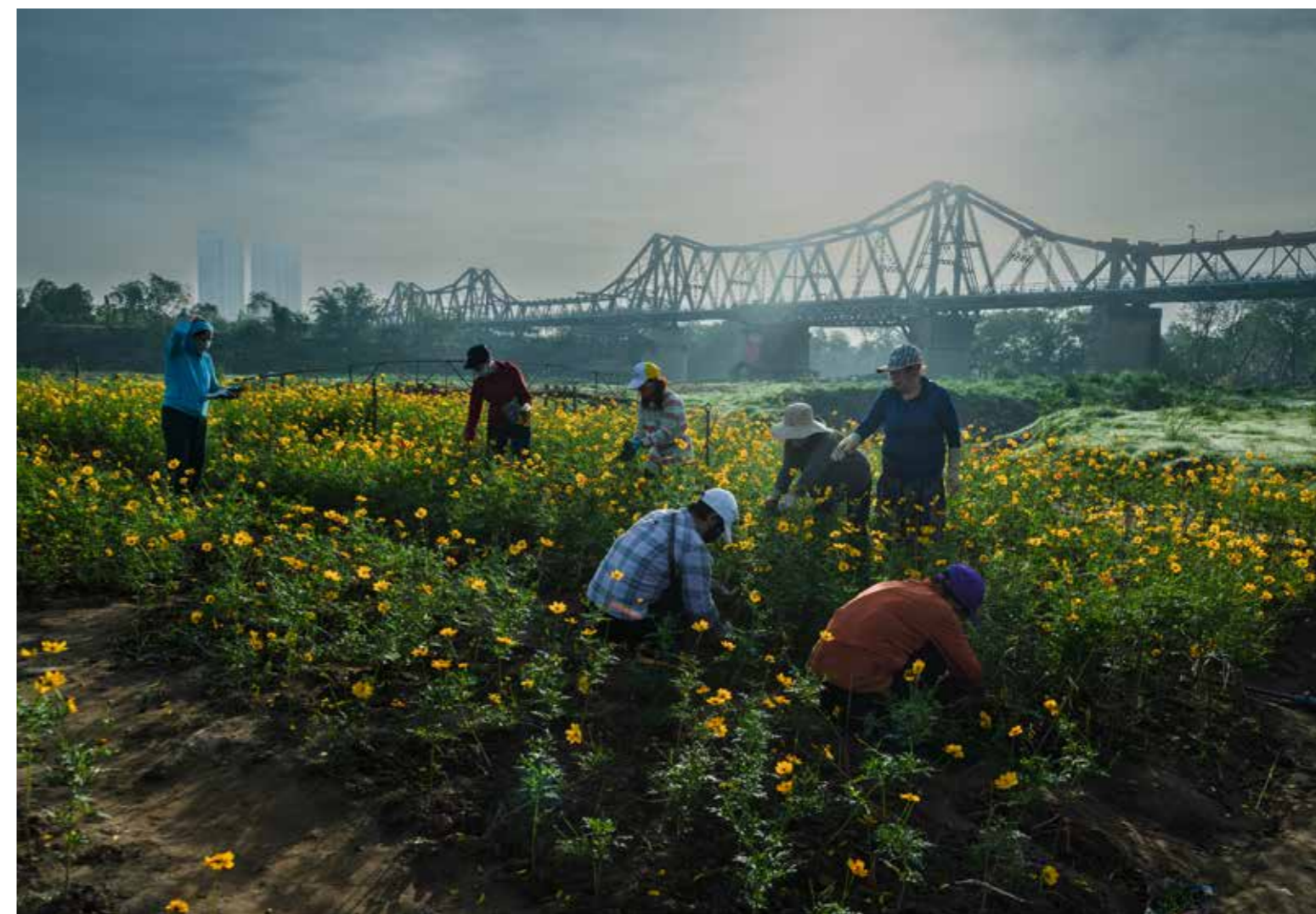
Bãi rác thành vườn hoa dưới bàn tay phụ nữ Thủ đô