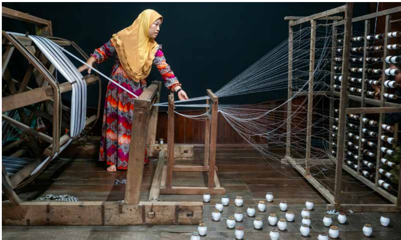
Se chỉ dân tộc chằm