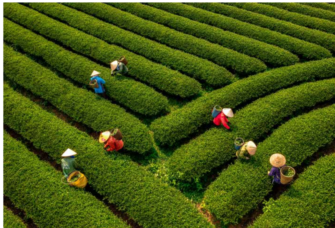
Thu hoạch chè Ô Long