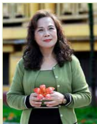
Trần Thị Kim Ngân / 1959