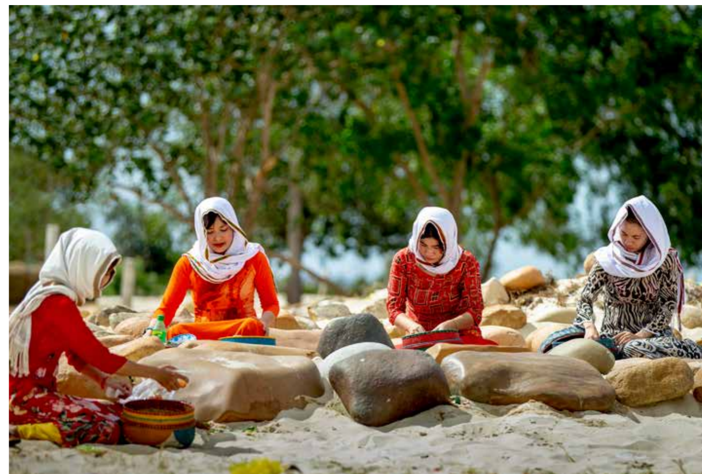
Lễ Tảo mộ của người Chăm