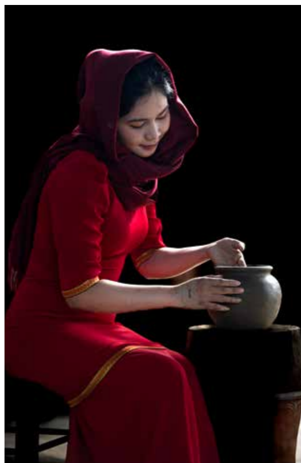
Phụ Nữ Chăm với nghề truyền thống