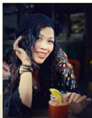
Đường Hồng Mai / 1973