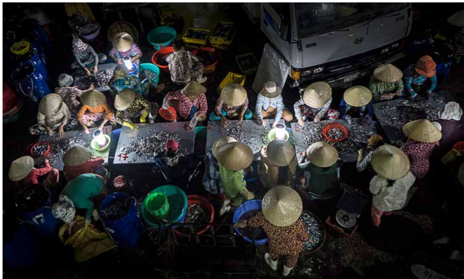
Nhật cá cơm