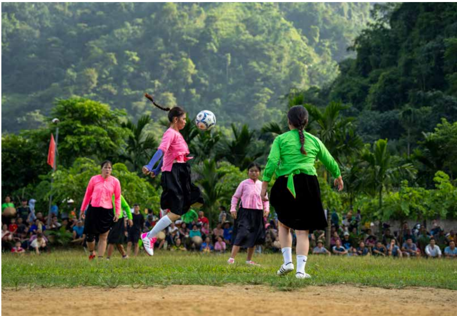
Niềm vui sau công việc hàng ngày