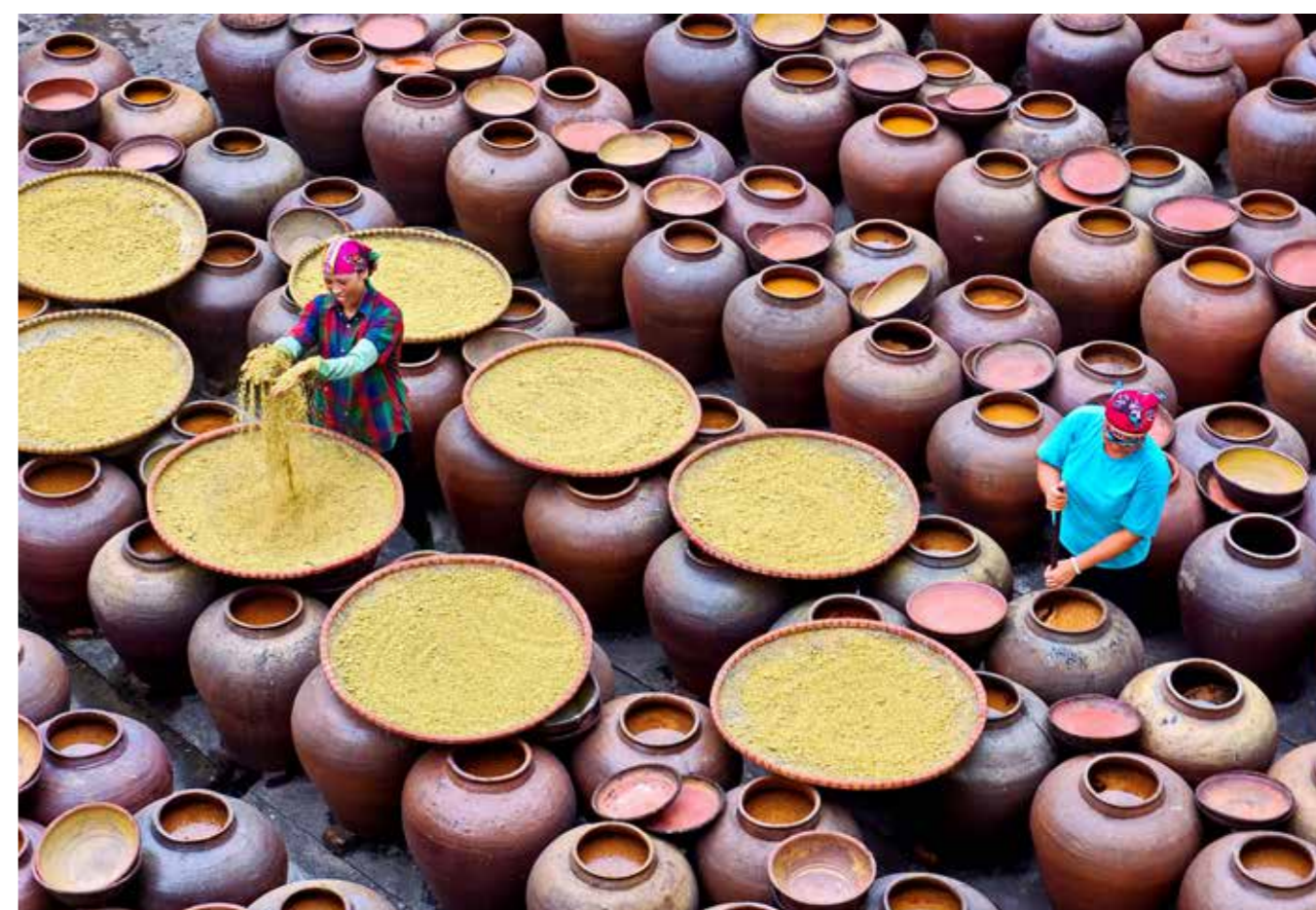
Nghề làm tương