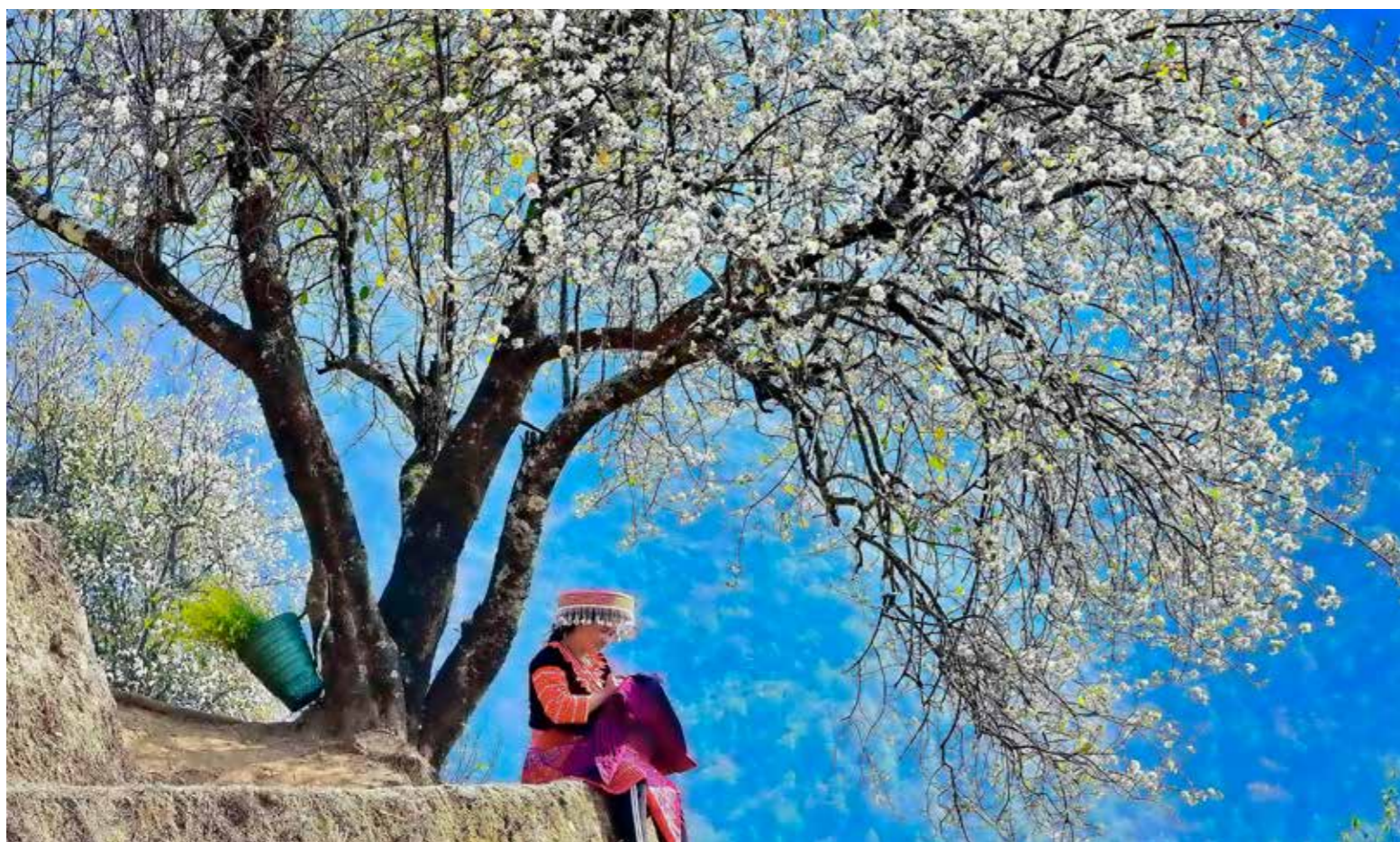
Sau giờ lên nương