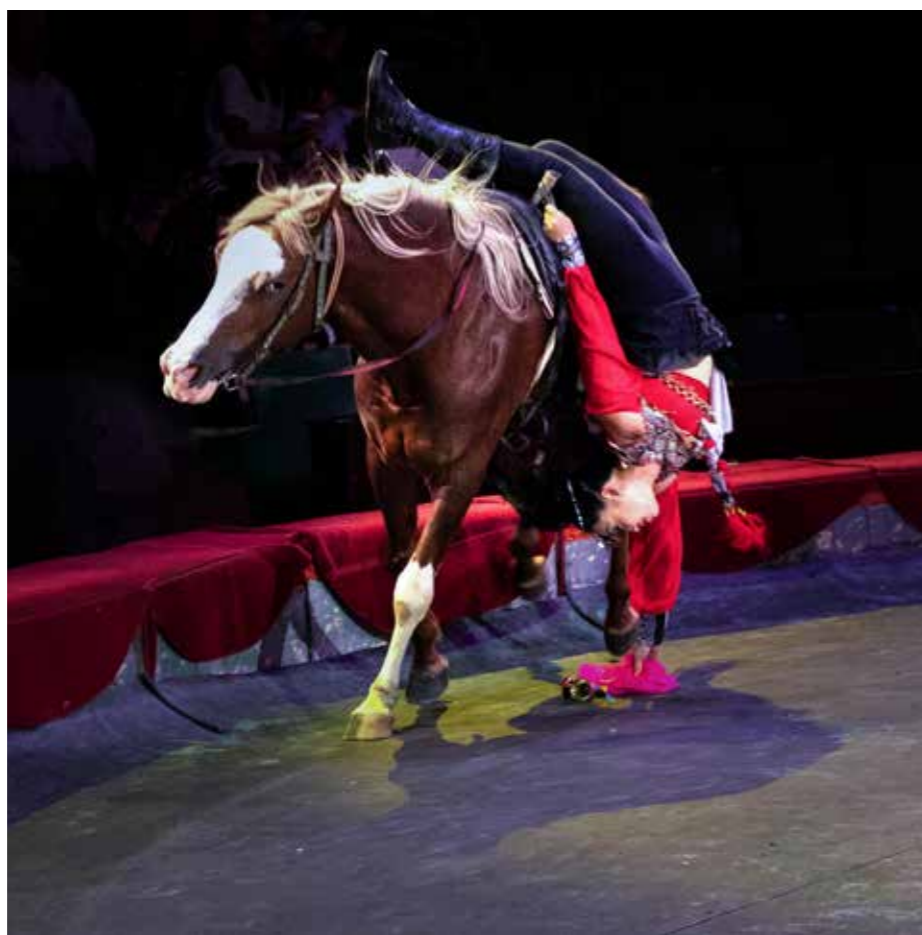
Nữ diễn viên xiếc