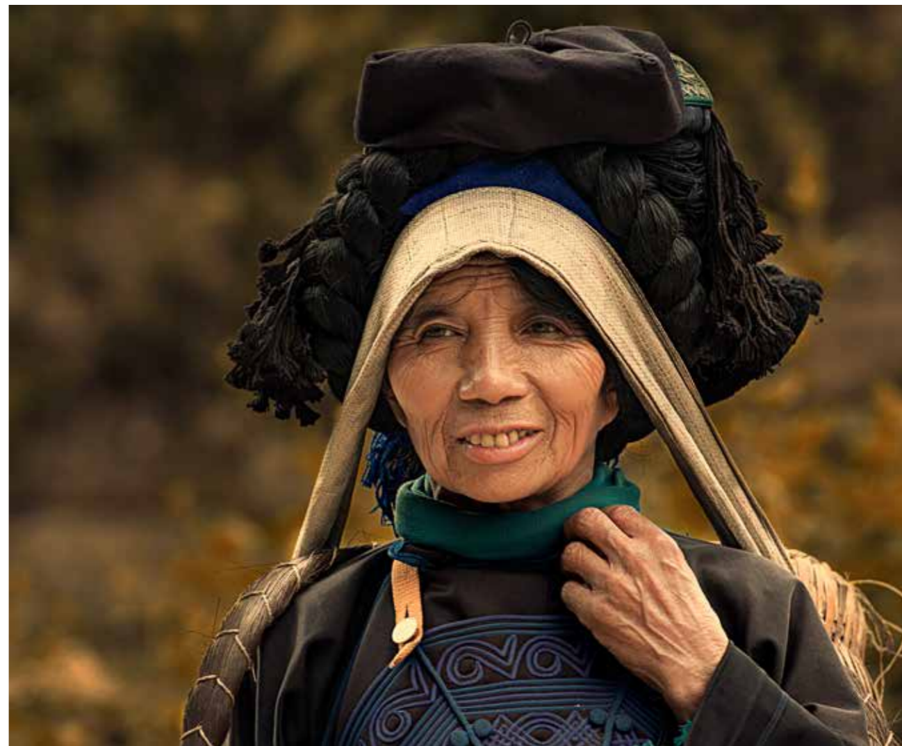
Người phụ nữ Hà Nhì