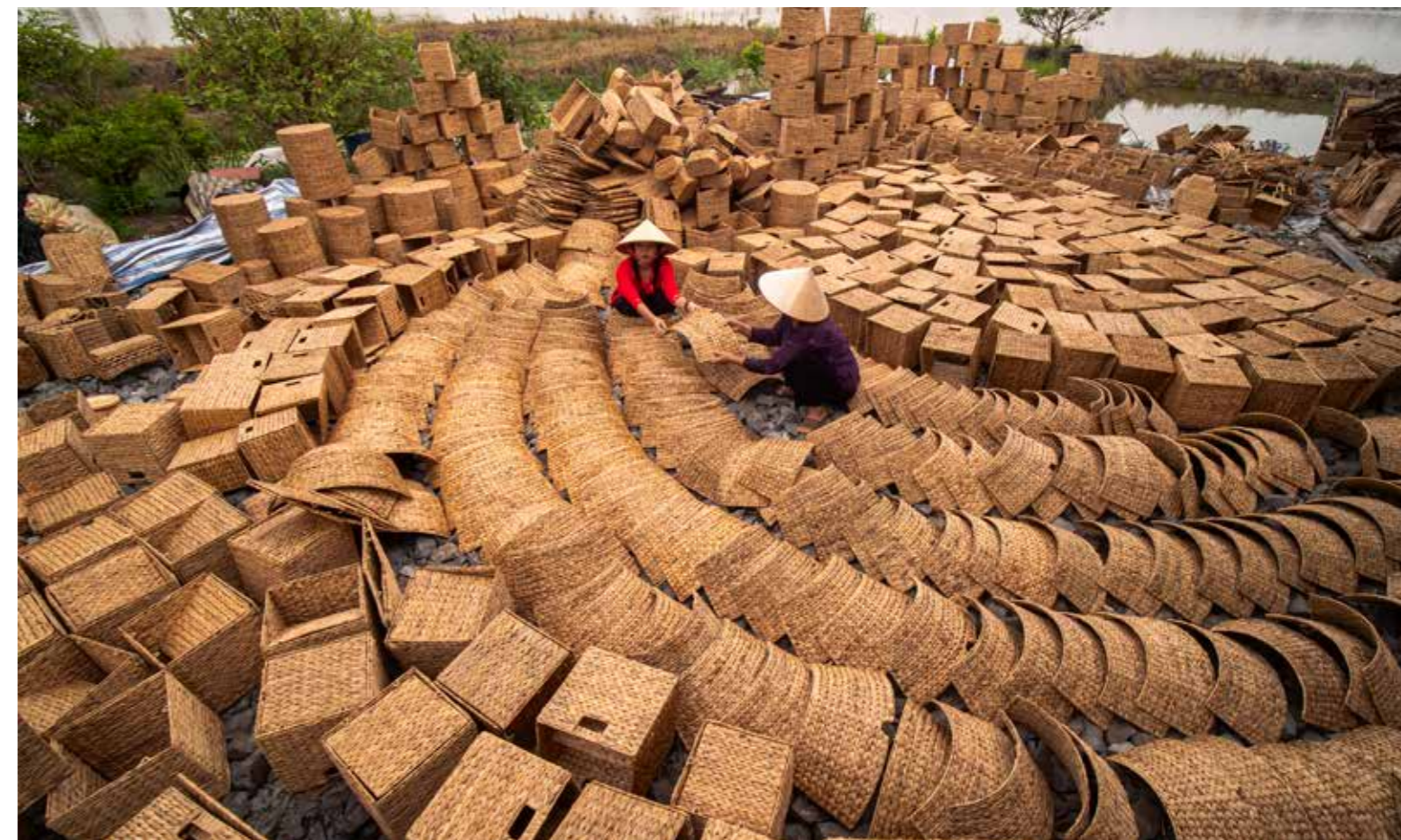
Hàng thủ công xuất khẩu An Giang