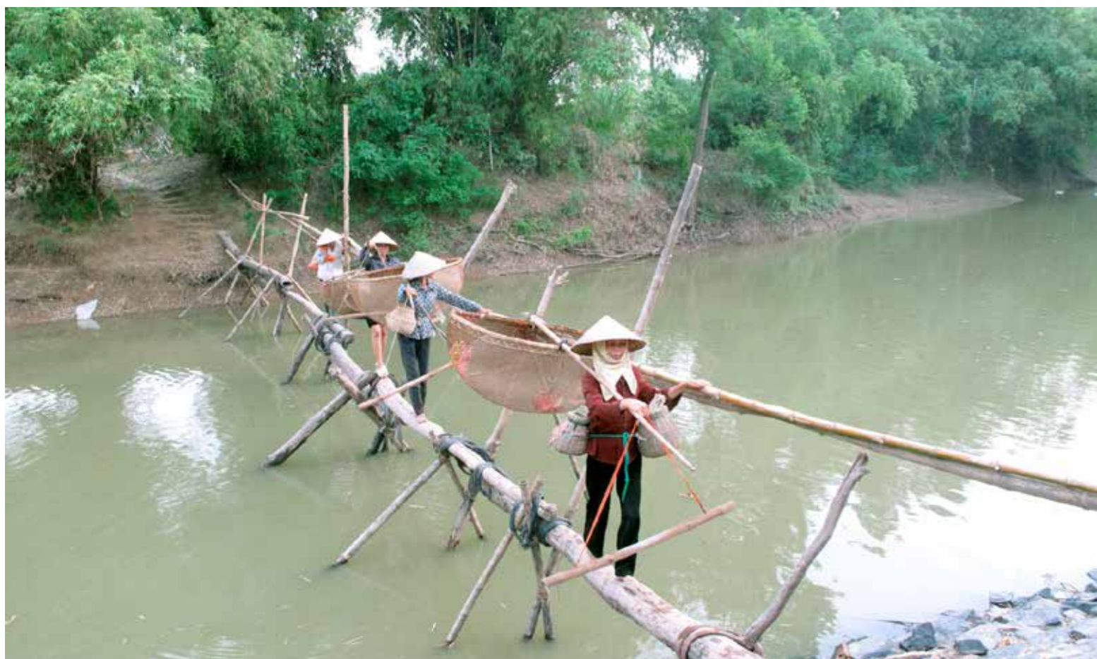
Công việc hàng ngày