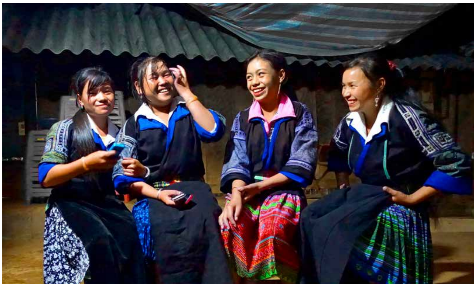
Thiếu nữ Mông