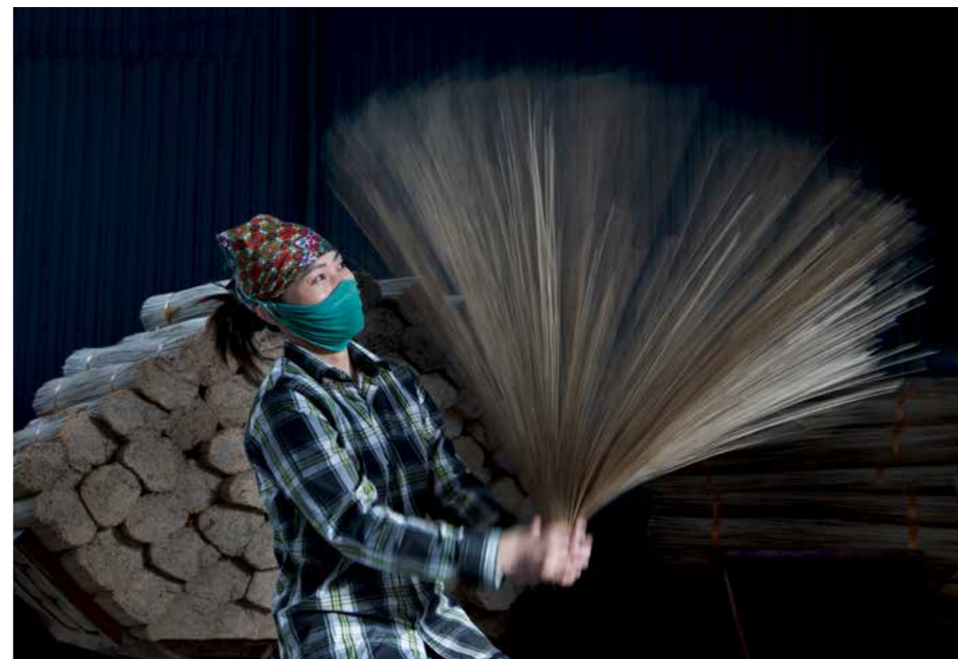
Người thợ làm hương