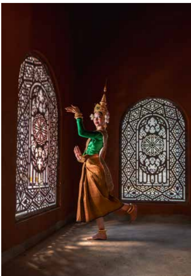
Điệu múa Apsara