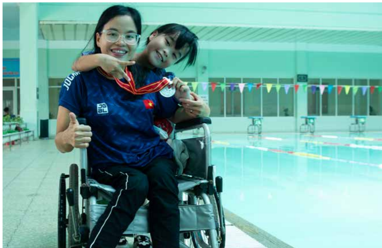
Nụ cười chiến thắng của hai mẹ con Vận động viên khuyết tật Sari