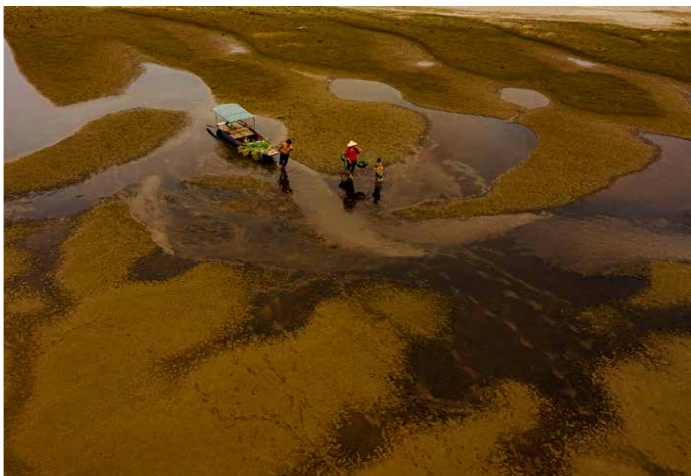
Trở về lúc hoàng hôn