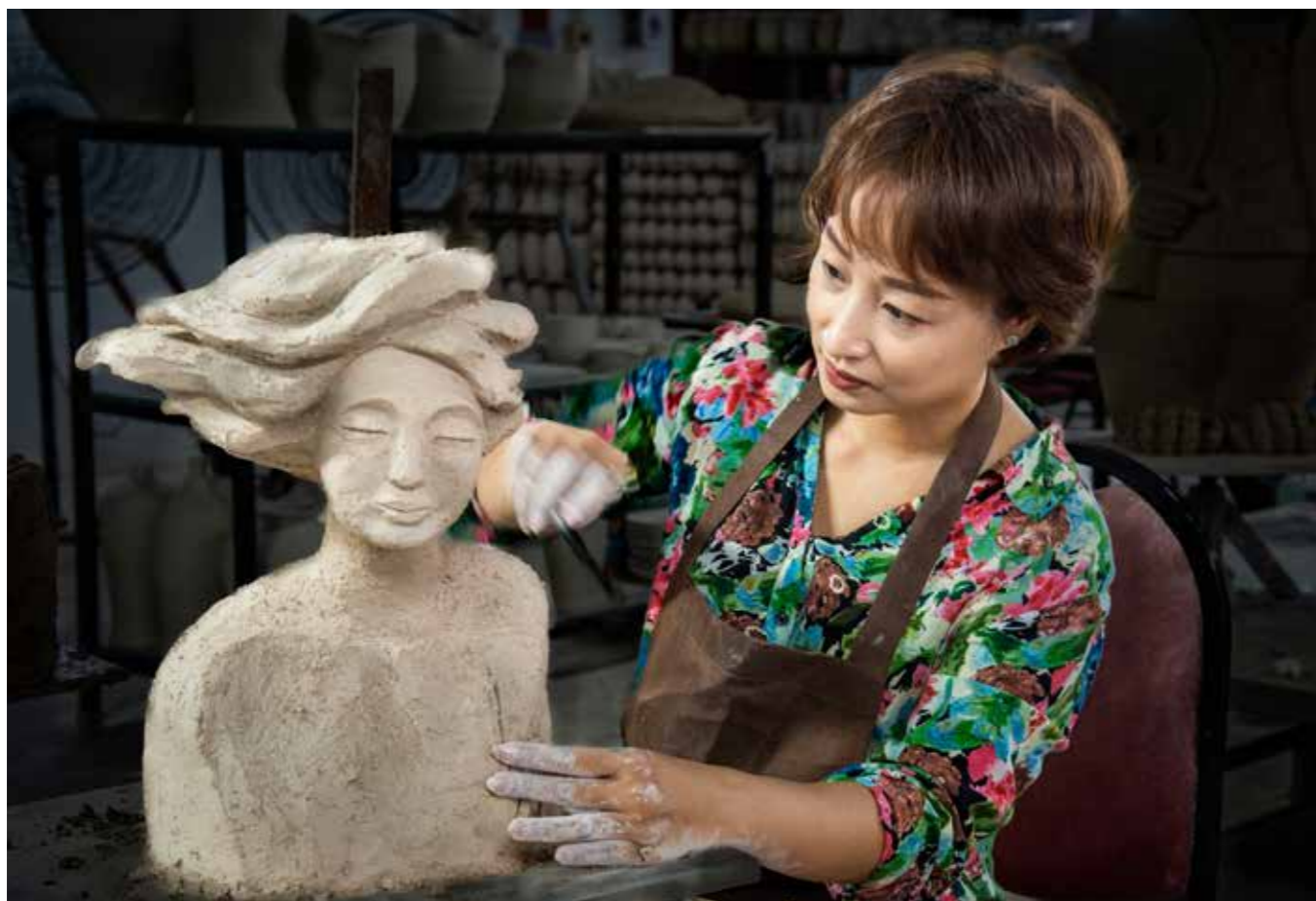
Nghệ thuật tạo hình gốm Bát Tràng