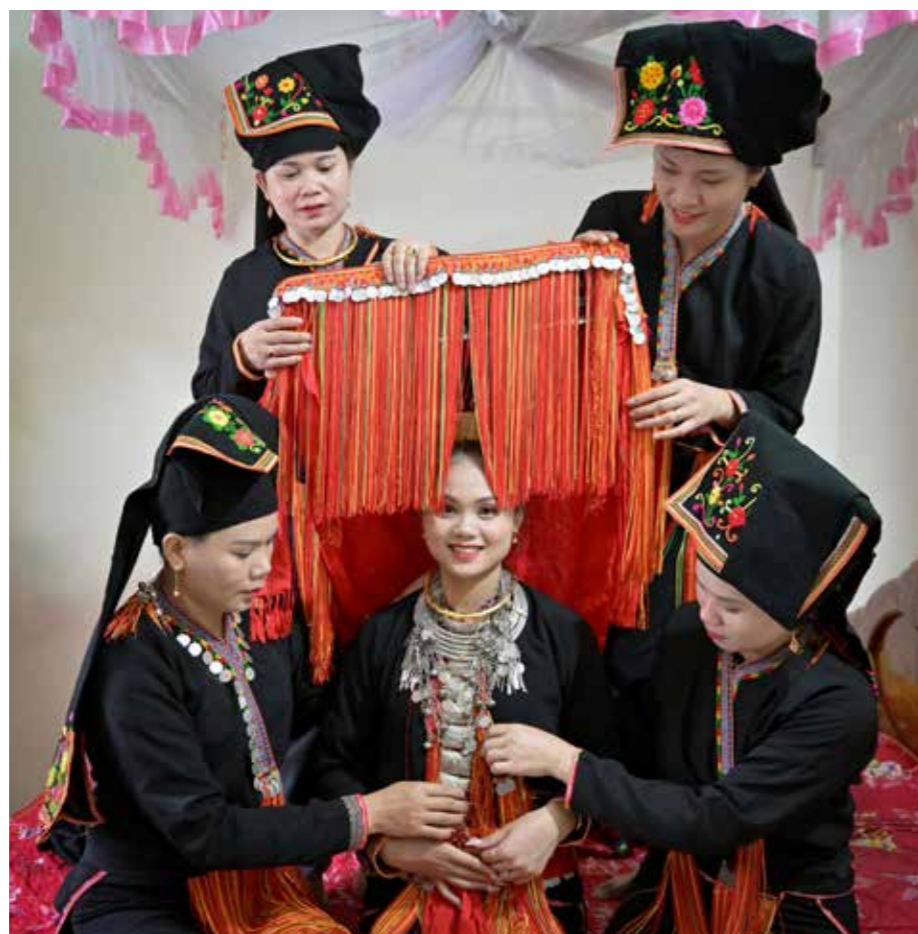
Cô dâu người Dao Yên Bái