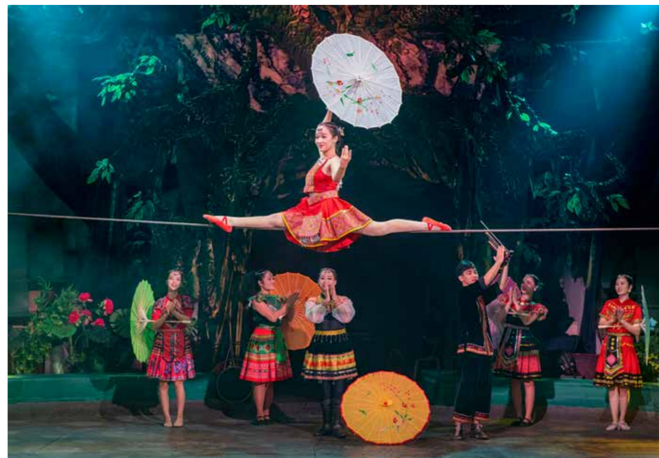
Thăng bằng trên dây