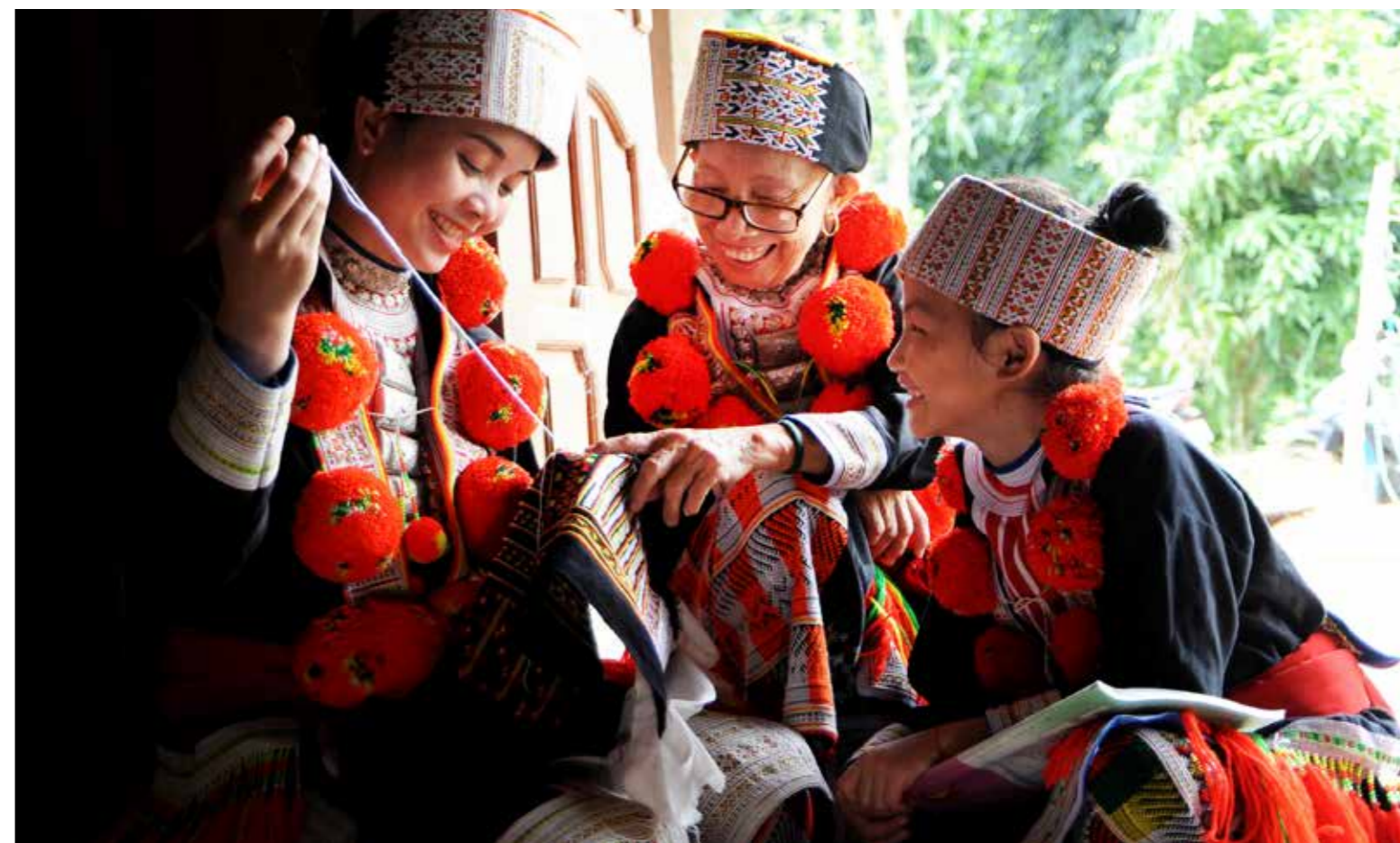
Đẹp rồi con