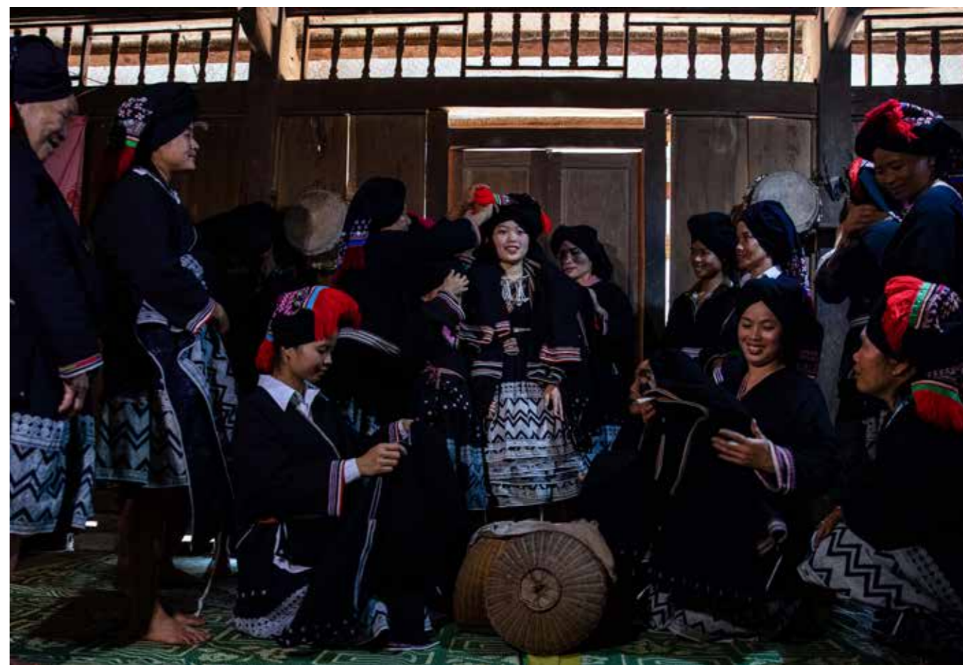
Không khí chuẩn bị cho cô dâu về nhà chồng