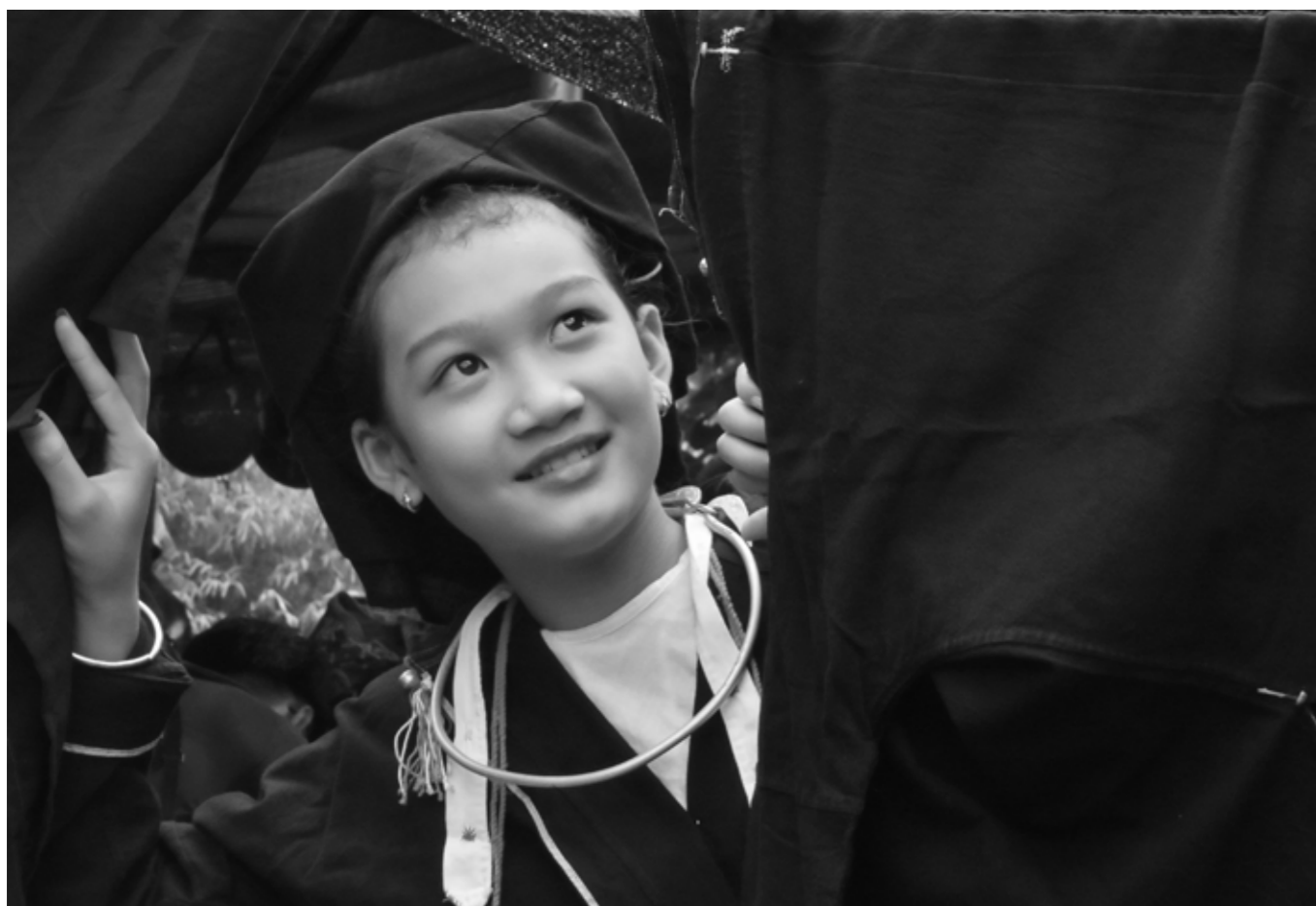
Sắc xuân Sán Dìu