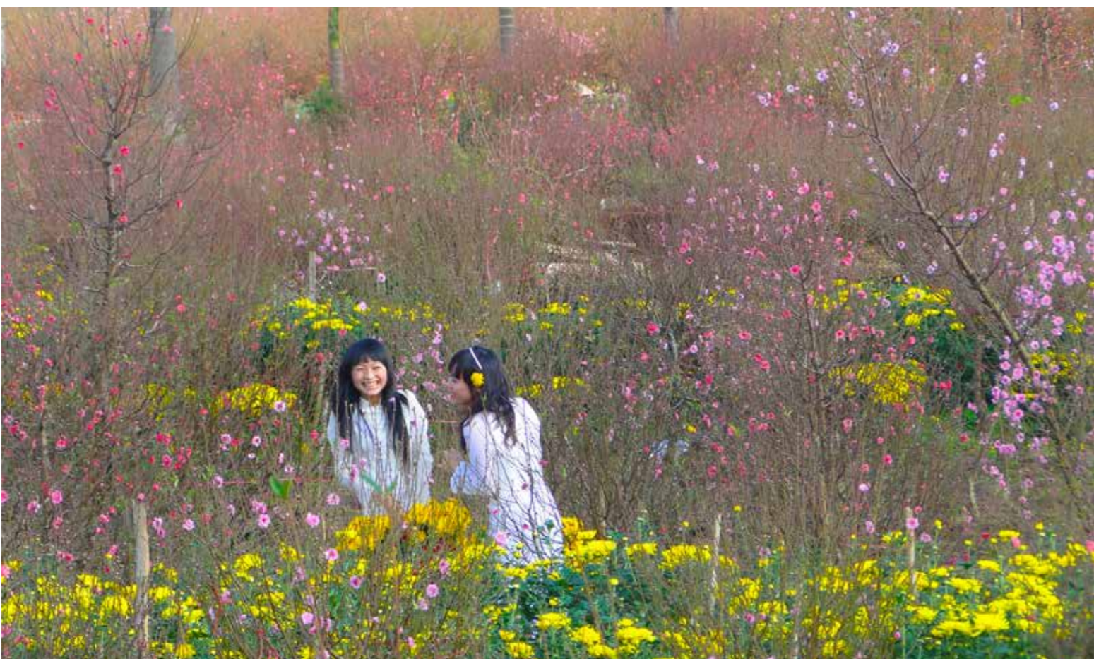
Những đóa xuân đang nở