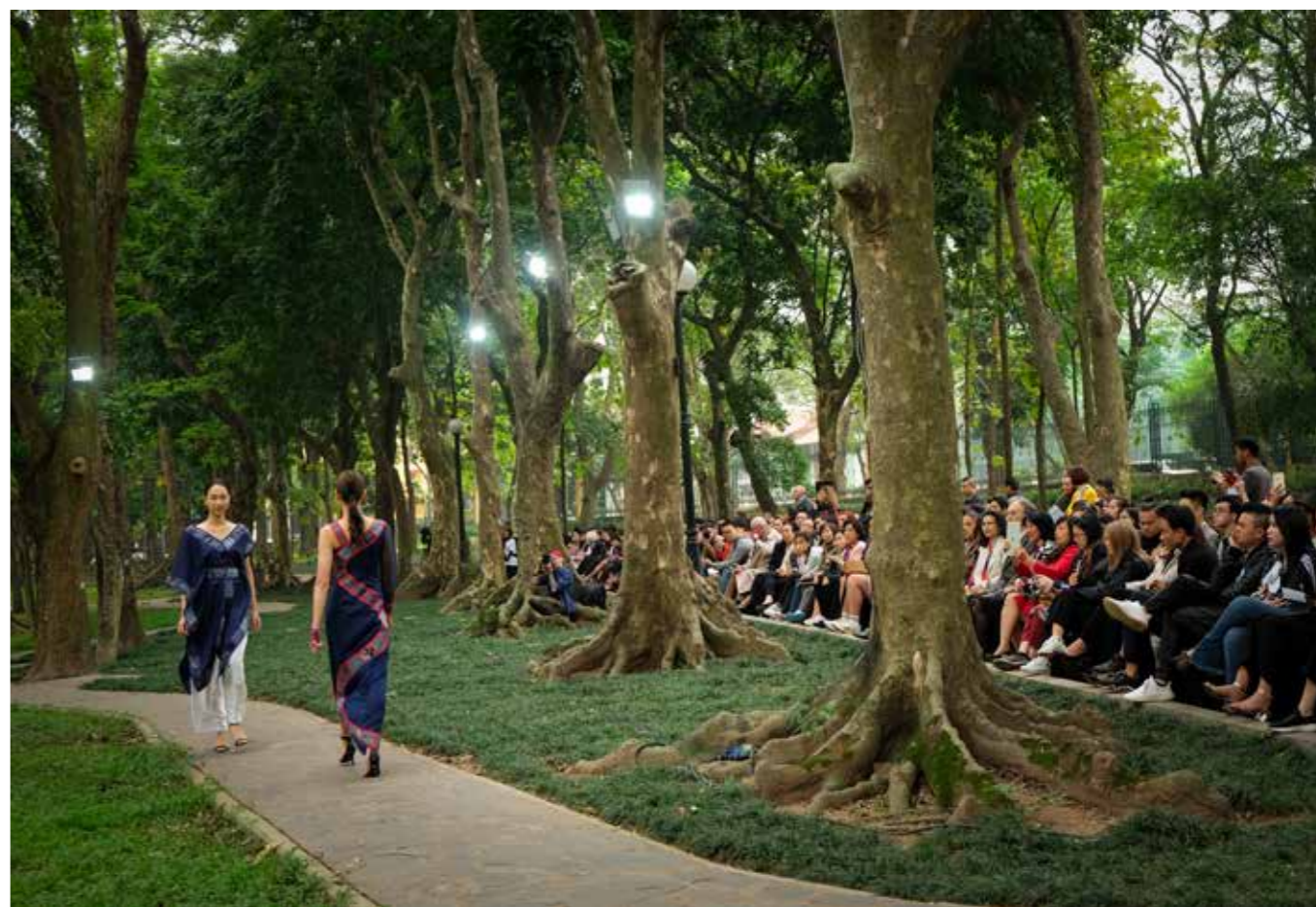
Nét duyên dáng của người phụ nữ trong trình diễn thời trang