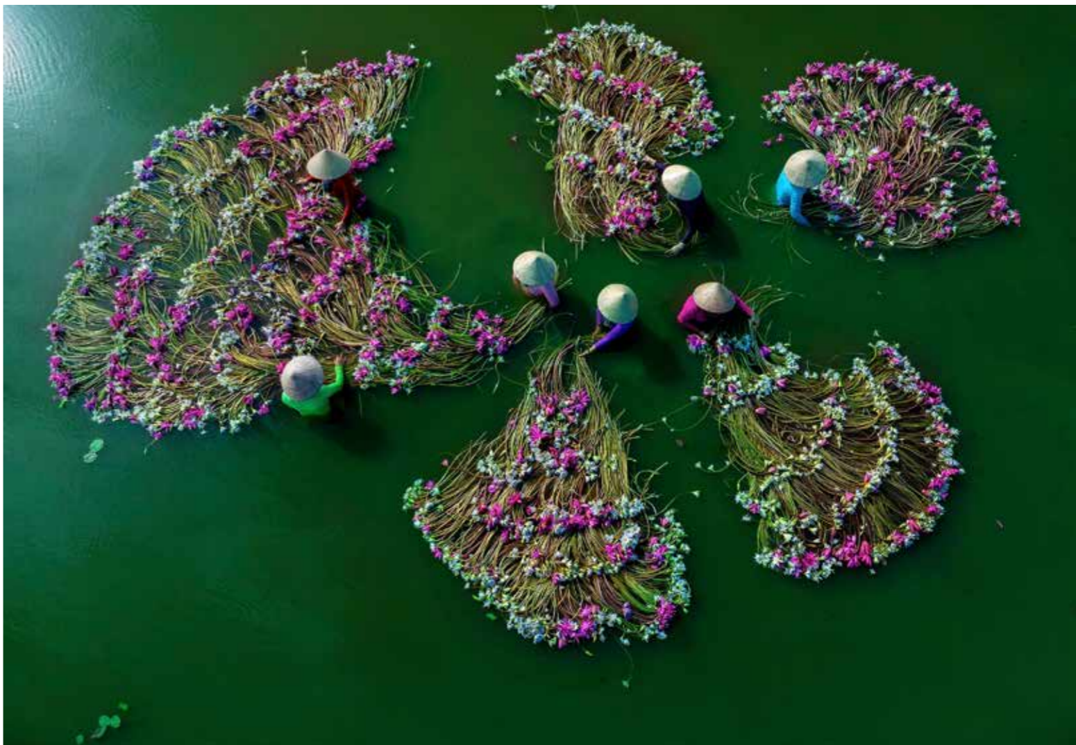
Thu hoạch hoa súng