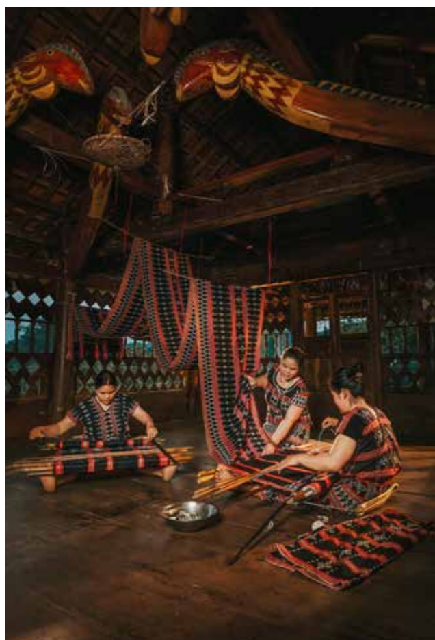
Phụ nữ Tà Ôi với nghề dệt Zèng