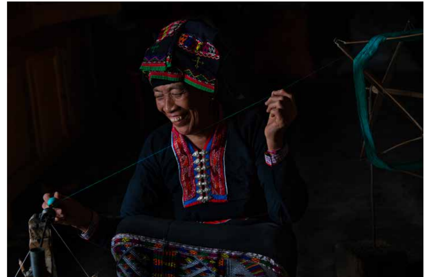
Phụ Nữ Dân tộc Lào bên khung cửi