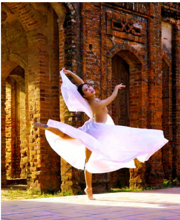
Một buổi tập ngoài trời