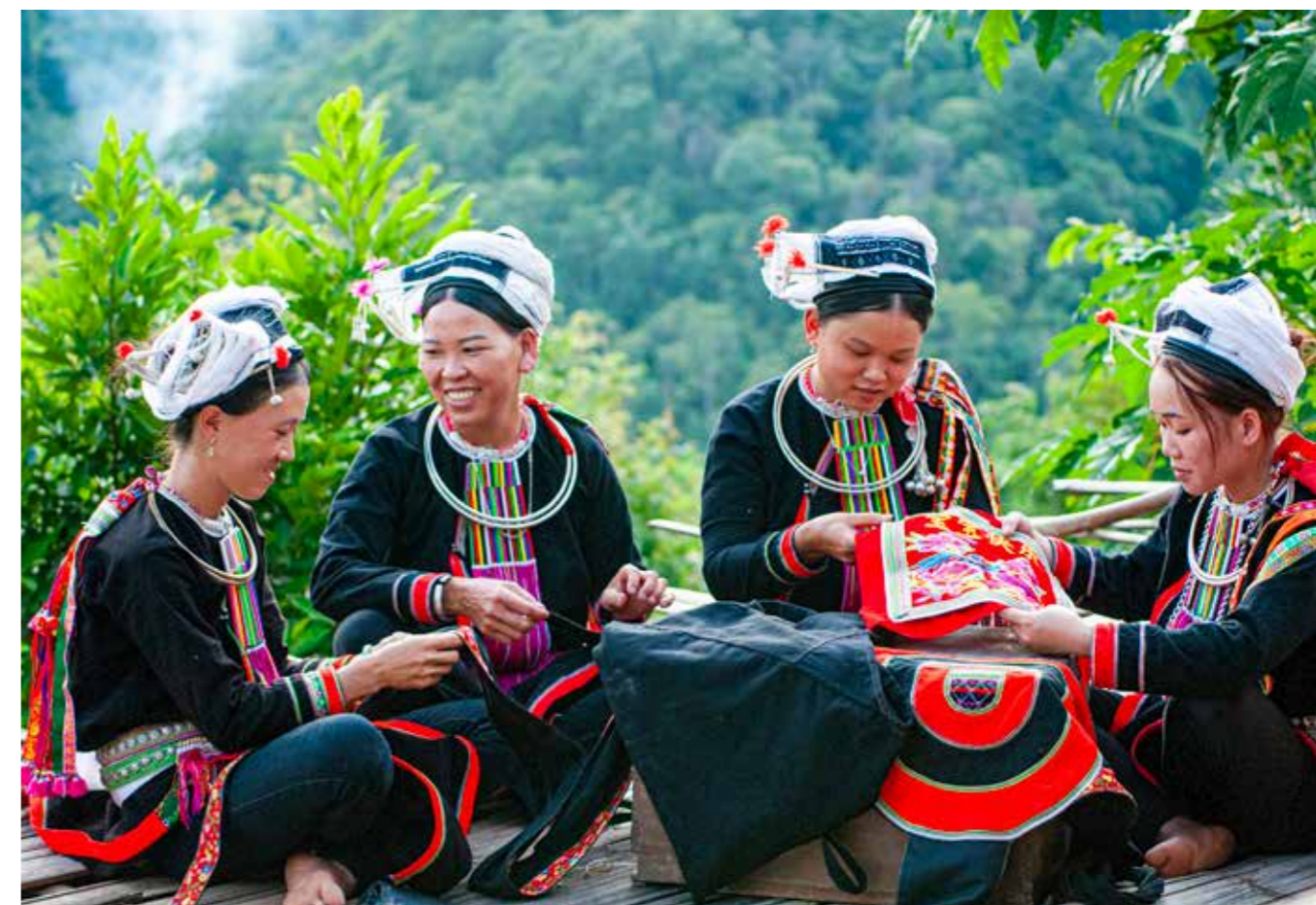
Thiếu nữ Sán Chẻ