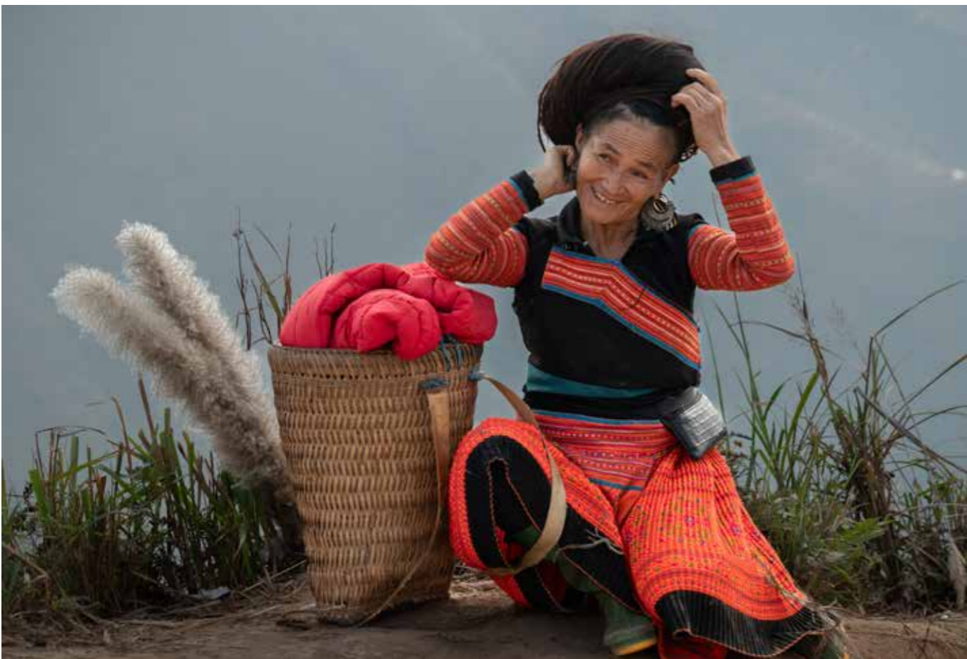
Phút dừng chân