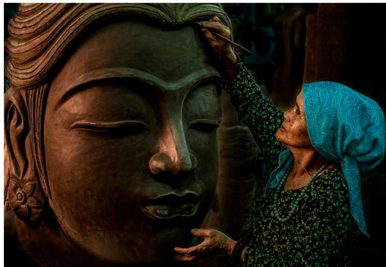
Người thổi hồn cho tượng