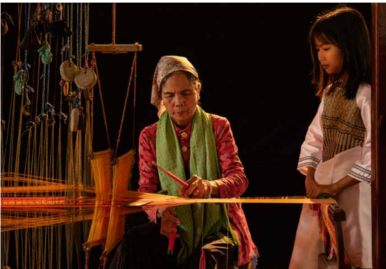
Học bà dệt