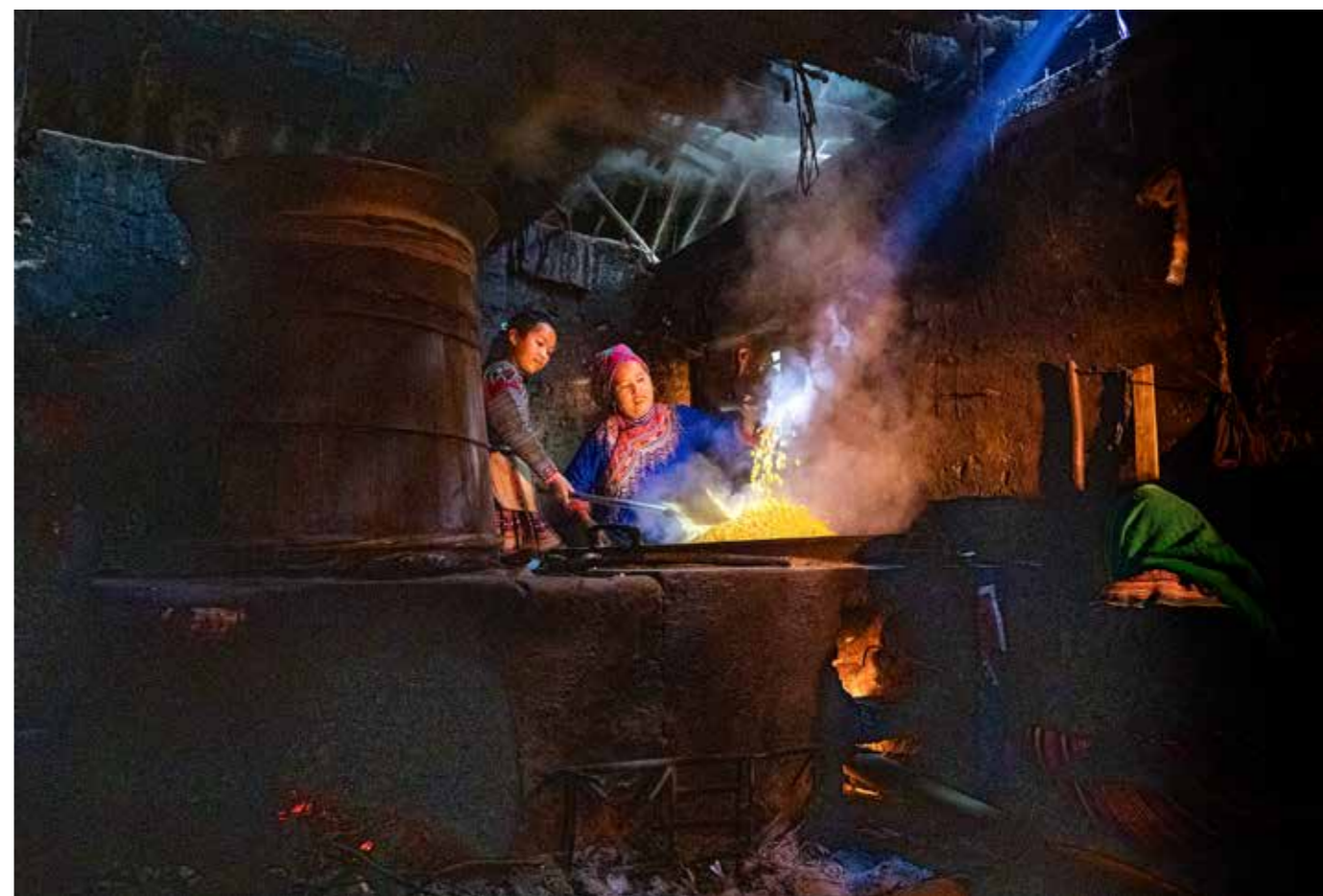
Nấu rượu ngô