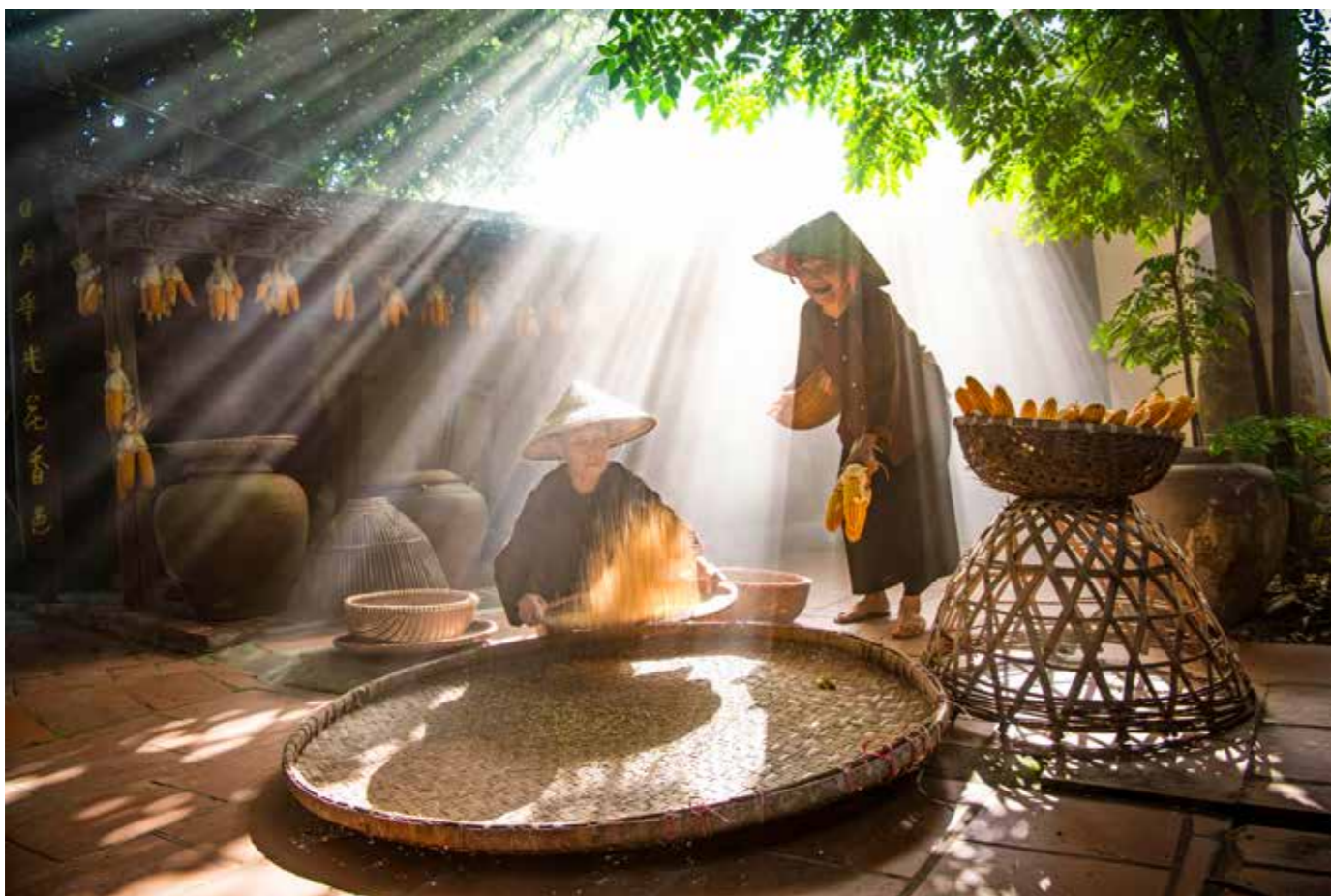
Đôi bạn trong nắng chiều