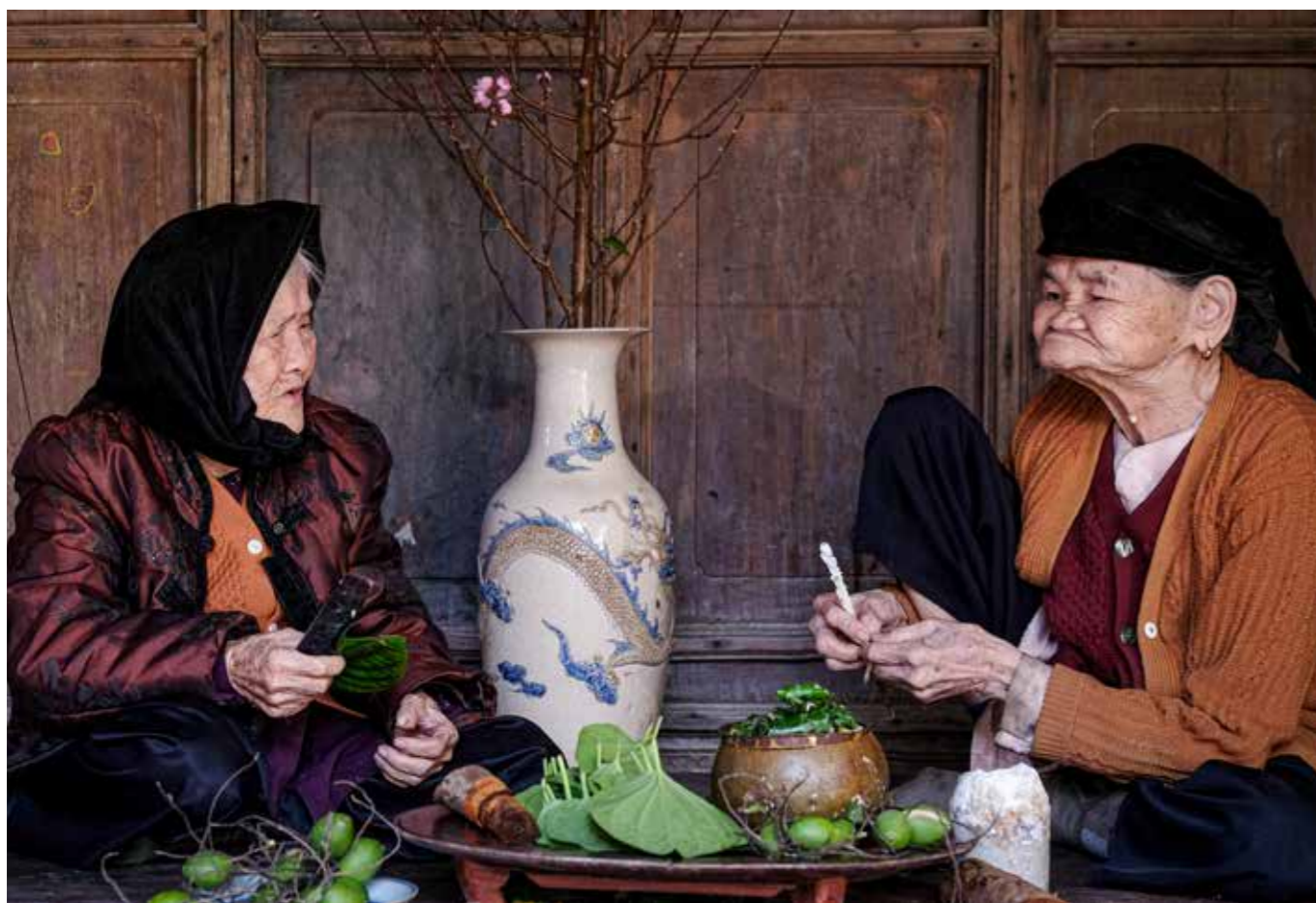
Tình bạn trâu cau