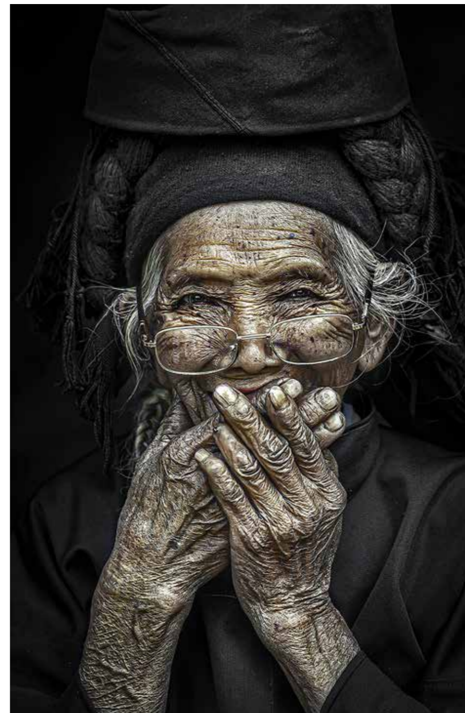
Hạnh phúc giản đơn của cụ già Tây Bắc