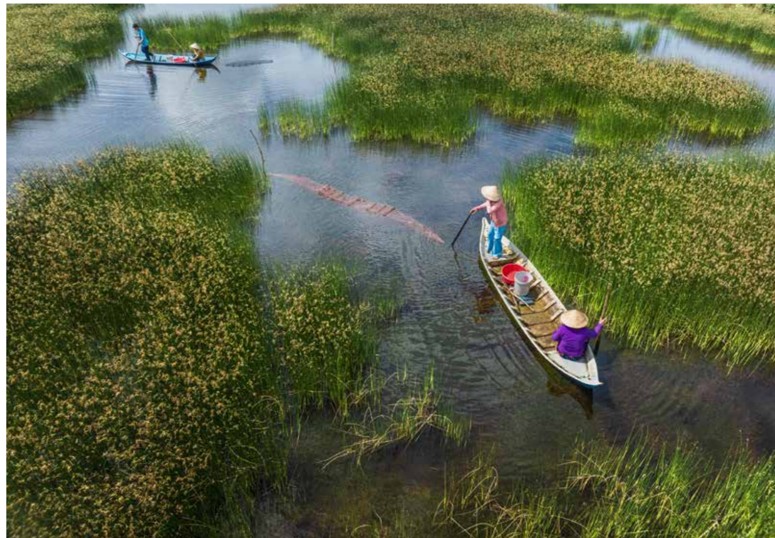
Trên đồng cỏ Năn tượng