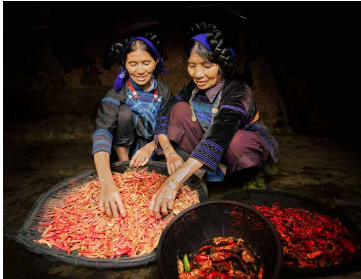
Sắc đỏ Hà Nội