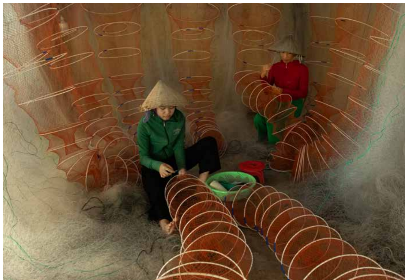
Vá lú (lưới)