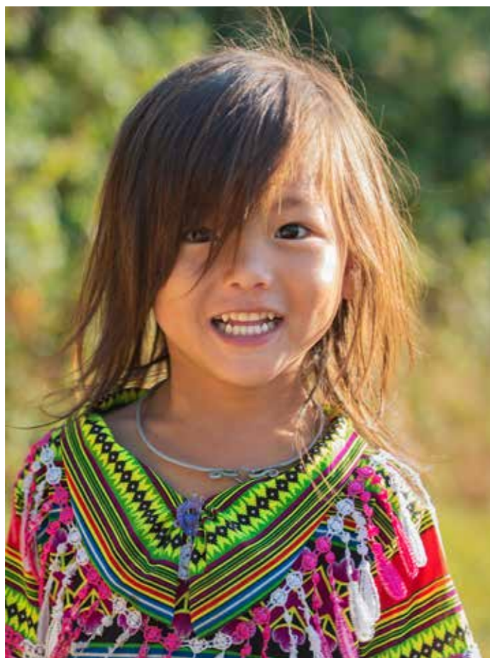
Tuổi thần tiên